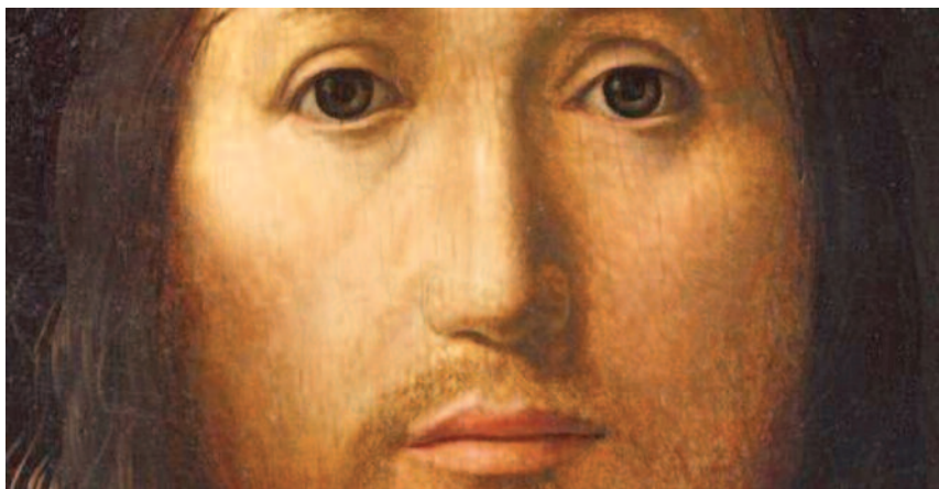
Antonello da Messina: Salvator mundi (dett.) - Dio che sfugge completamente a qualsiasi possibilità di essere capito, nella sua natura, è quello che ci chiama a riconoscerlo in Cristo

I profeti parlano di questo Dio presentandolo come l'unico Dio esistente. La rivelazione che avviene con Gesù Cristo approfondisce la comprensione della sua natura. Gesù Cristo la attua iniziando dalla sua persona che, poiché ha assunto con l'incarnazione la natura umana, si relaciona con il Dio creatore invocandolo come suo padre. Al concetto di Creatore che già lo rivelano onnipotente, sapiente, perfetto e buono, somma il concetto di misericordioso, cioè presenta Dio come la bontà che fedele a se stessa