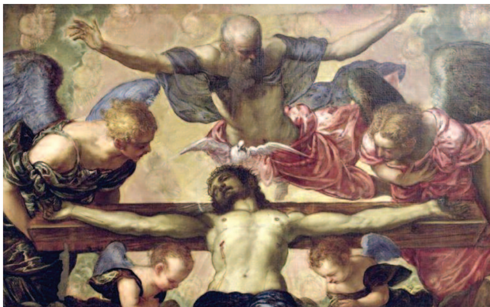
Tintoretto: la Trinità

Tuttavia, quello che sembra procedere da una sola persona divina è,