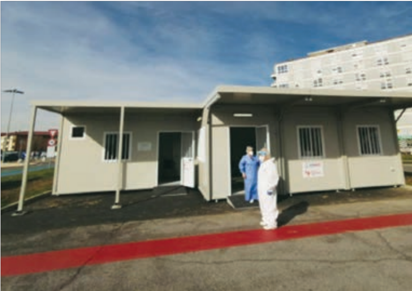
La struttura per il pre-triage allestita dal Cuamm a Cremona.

Il nostro stile è continuare a vivere in Italia quanto abbiamo imparato in Africa. Circa 2.000 medici in 70 anni hanno servito per 3 anni ciascuno e sono rientrati in modo operativo nelle strutture sanitarie nazionali. Durante il Covid, ad esempio, sul versante delle risorse umane li abbiamo sostenuti e molti hanno portato in prima linea la loro esperienza nella gestione delle pandemie. E per quanto riguarda le strutture sanitarie abbiamo voluto dare segnali concreti di solidarietà. Abbiamo