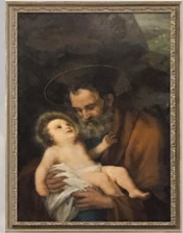
San Giuseppe con Gesù Bambino. Milano chiesa di san Barnaba,