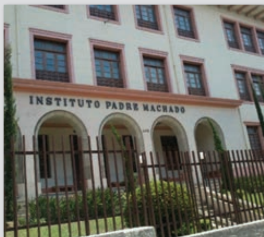
L'Istituto Padre Machado di Belo Horizonte (MG-Brasile) compie 100 anni