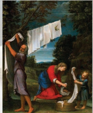
Madonna del bucato (1620) Lucio Massari.