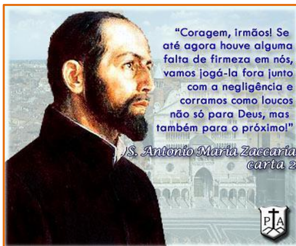
Santo Antônio Maria Zaccaria, rogai por nós!

Deus ama o homem incondicionalmente, e não o fez para que ele fique aprisionado em si. Somos convidados por nosso Criador a sair de nossas comodidades e ir ao encontro dos demais, pois somos por natureza um “eu” em entrega . Por isso, não devemos permitir que a indecisão e as falsas desculpas, impeçam que sejamos verdadeiros amantes de Cristo, fervorosos, solícitos e decididos.