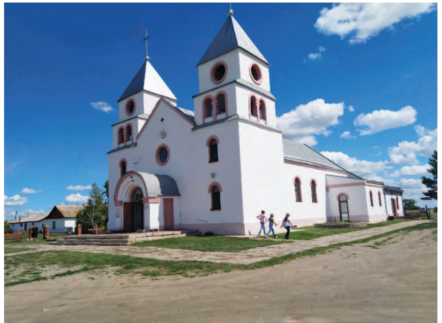
il Santuario di Oziornoje