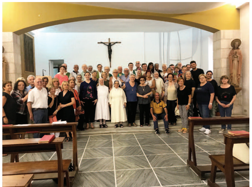
foto di gruppo dei partecipanti dei tre collegi della Famiglia Zaccariana al meeting di Napoli

In un clima di sincera fraternità e lietezza i Laici di San Paolo, i Barnabiti, le Angeliche e gli Ospiti intervenuti hanno vissuto le giornate alternando momenti di studio e di dibattito con altri di convivialità e leggerezza,