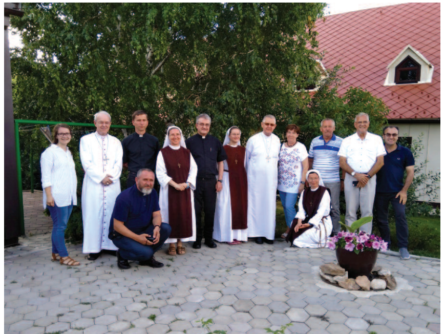
con le Suore delle Beatitudini di Kokshetau