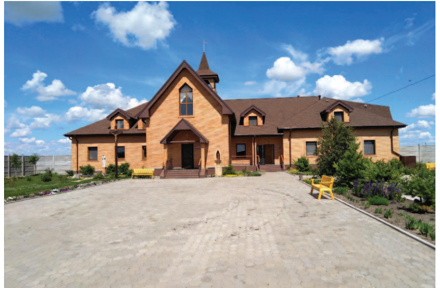
il Carmelo di Oziornoje