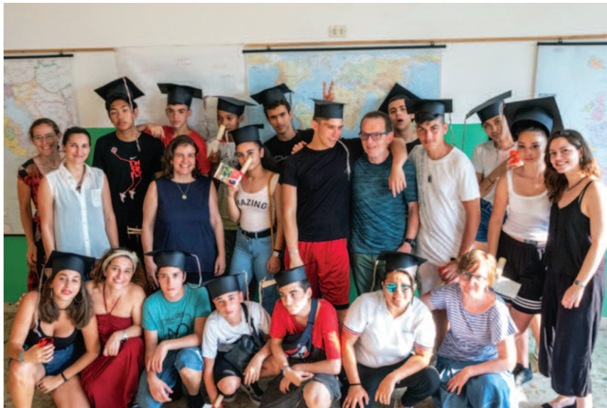
i diplomati in festa con i loro docenti