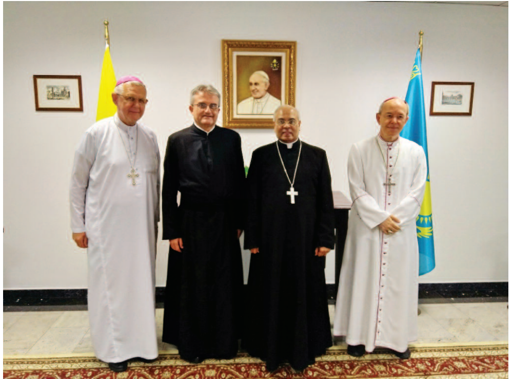
visita al Nunzio