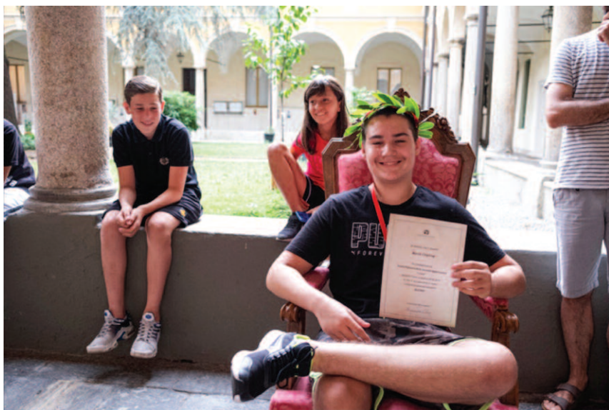
la gioia del lavoro compiuto e ben fatto