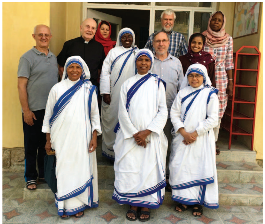
la gioia di ritrovarsi tra collaboratori missionari