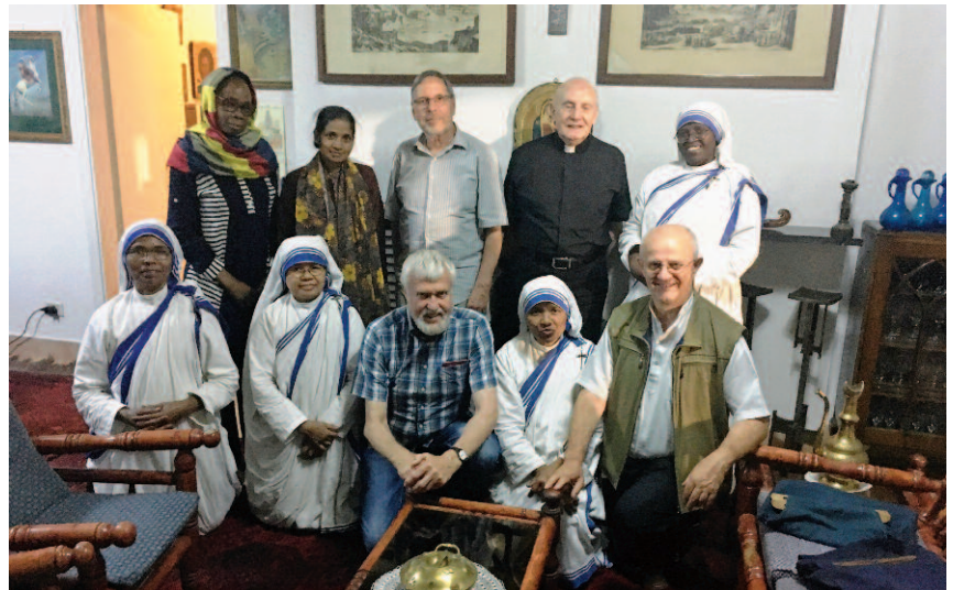
con religiose e religiosi presenti a Kabul