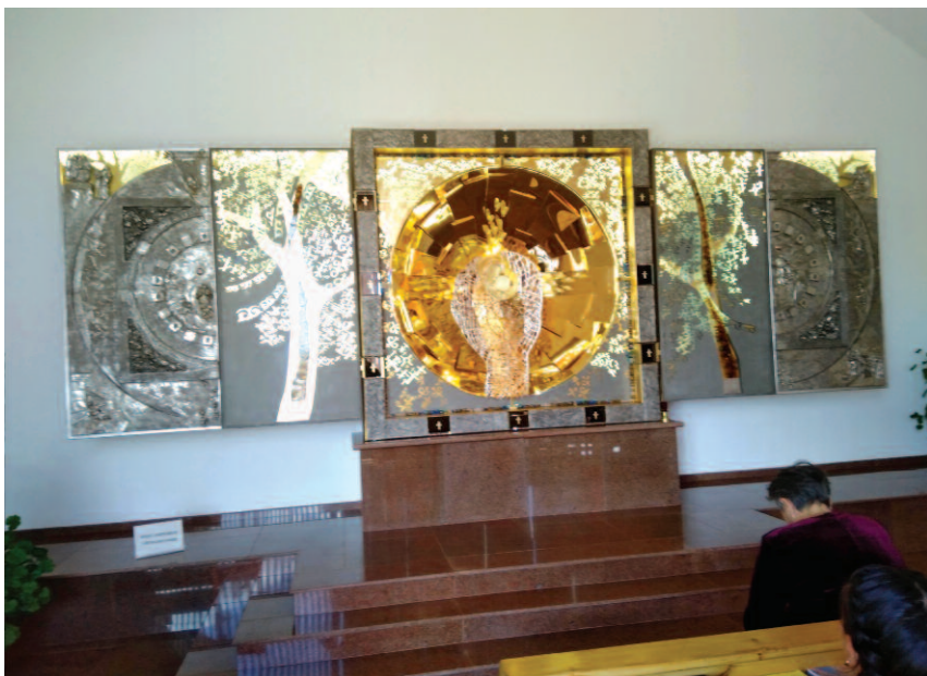
il grande ostensorio