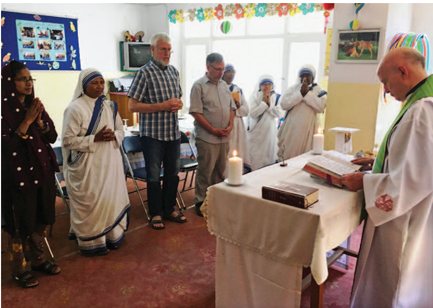
celebrazione eucaristica nella cappella della Comunità "Pro-Bambini" di Kabul

Sebbene non sia andato a Kabul come turista, tuttavia, pur consapevole della concreta impossibilità di attuazione, avrei tanto desiderato rivedere il Palazzo reale e il Palazzo dei Ministeri a Darullaman ristrutturati, il giardino di Babur rivitalizzato, il museo nazionale ricomposto, e vagabondare tra i bazar. Sono rimasti solo un desiderio. Purtroppo, sempre