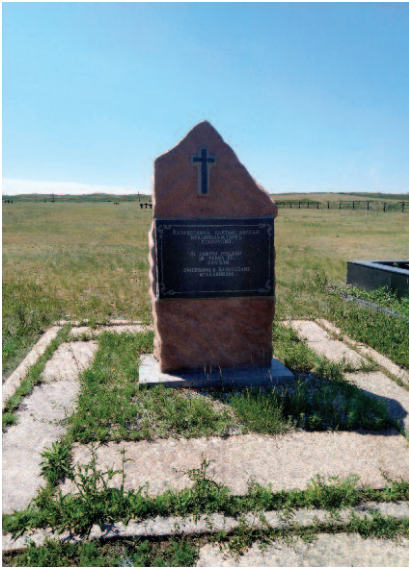
il memoriale ai caduti italiani

bene. Nel 2001 è stata visitata anche da Papa Giovanni Paolo II. Nel 2006 vi è stato costruito il Palazzo della pace e della riconciliazione, per ospitare il Congresso dei leader del mondo e delle religioni tradizionali, che si tiene ogni tre anni nella capitale kazaka. La sera abbiamo cenato in un ristorante tipico locale, sotto una yurta .