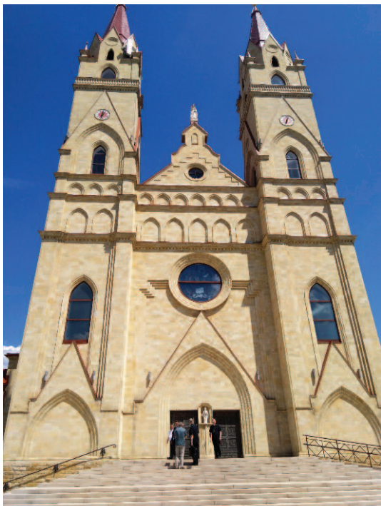
la nuova cattedrale di Karaganda

tuario mariano nazionale, per celebrare la festa liturgica della Regina della pace, patrona del Kazakistan. Per l'occasione molti pellegrini si recano, anche a piedi, al Santuario, che è stato edificato in un luogo cari-