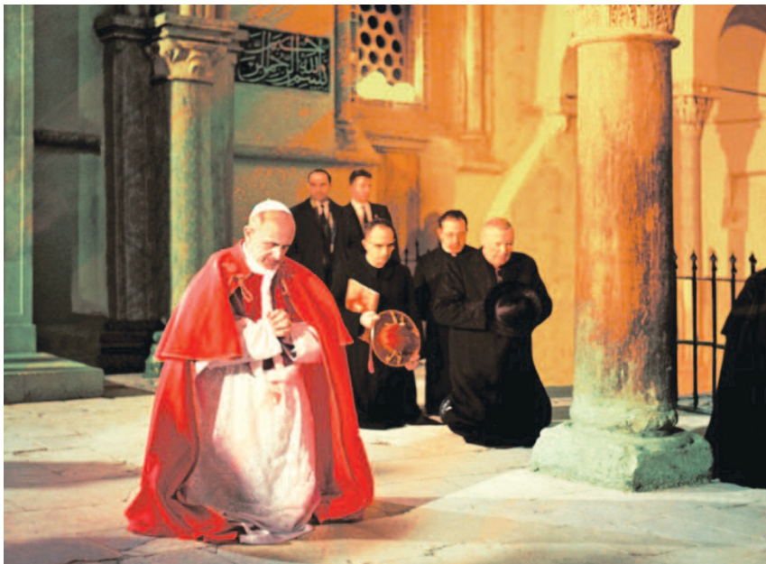
Paolo VI in preghiera nel Cenacolo - gennaio 1964

«La casa di Nazaret ci insegna il silenzio. Oh! se rinascesse in noi la stima del silenzio, atmosfera ammirevole ed indispensabile dello spirito: mentre siamo storditi da tanti frastuoni, rumori e voci clamorose nella esagitata e tumultuosa vita del nostro tempo. Oh! silenzio di Nazaret, insegnaci ad essere fermi nei buoni pensieri, intenti alla vita interiore, pronti a ben sentire le segrete ispirazioni di Dio e le esortazioni dei veri maestri. Insegnaci quanto importanti e necessari siano il lavoro di preparazione, lo studio, la meditazione, l'interiorità della vita, la preghiera, che Dio solo vede nel segreto» (Paolo VI, Discorso a Nazaret, 5 gennaio 1964).