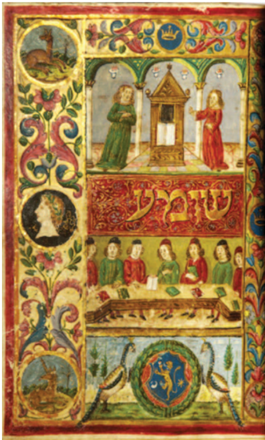
Shema' - Manoscritto ebraico del Mahzor (libro di preghiere, ca. 1490), f. 240

l'arco di un anno. Quindi, a seguire, la lettura di una pericope profetica corrispondente al brano letto – chiamata haftarah («probabilmente perché "conclude" la lettura della Toràh, proiettandola verso l'avvenire, verso l'attesa di un avvenimento che ancora deve compiersi»: R. Torti Mazzi). Il lettore poteva commentare i versetti che aveva letto; in tal caso si rimetteva a sedere e procedeva all'esegesi, o al racconto di un Midrash . Proprio questo è quanto compie Gesù nella sinagoga di Nazaret all'inizio del suo ministero pubblico, con la novità ermenutica della "spiegazione" di Isaia (Lc 4,16-30), anche se non è sicuro il testo della parashàh proclamata. La frequentazione e la familiarità di Gesù con la preghiera si manifesta non solo quando, nelle dispute con i farisei e i dottori della legge mostra di conoscere molto bene sia la Toràh , che i