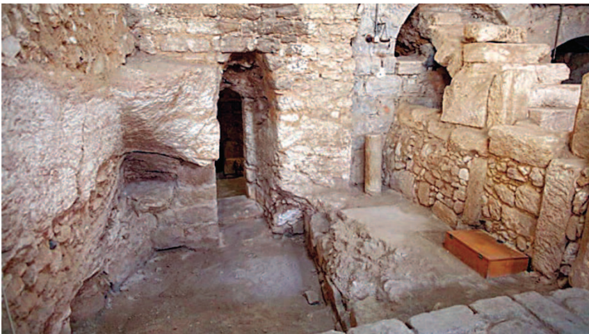
Nazaret, La Casa della Nutrizione, identificata da alcuni studiosi con la casa di Gesù