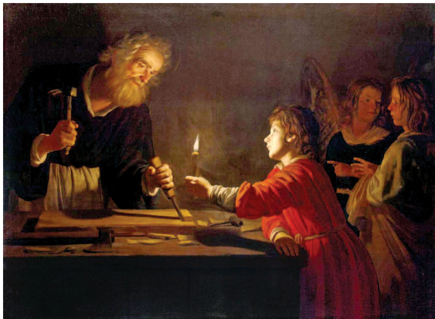
Gerrit van Honthorst, Infanzia di Gesù (1626) - San Pietroburgo, Museo dell'Ermitage

Il villaggio di Nazaret si estendeva lungo il crinale di una collina alla quale erano addossate semplici abitazioni, costruite attorno alle grotte che servivano per i lavori domestici e per l'alloggio degli animali. Era certamente sede di una sinagoga, in cui Gesù, in un giorno di sabato entrò e, aperto il rotolo del profeta Isaia, lesse e commentò la profezia che lo riguardava (Lc 4,16-27). Non distava molto da Sefforis, capitale amministrativa e commerciale della Galilea, ma non era certo un centro di prima importanza. Gli abitanti di Nazaret vivevano principalmente di agricoltura e di artigianato, secondo un tenore di vita molto semplice ed essenziale. I nuclei familiari si procuravano almeno parte del cibo necessario attraverso il lavoro dei campi e di questo ambiente "contadino" Gesù sicuramente conobbe e interiorizzò ritmi ed abitudini, come dimostra il