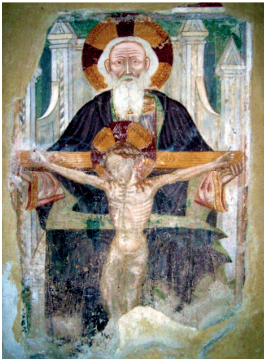
Cristo e Dio Padre - Varese, S. Maria della Purificazione, sec. XIV

La consapevolezza dell'«Ora», inoltre, viene riassunta dal verbo agapao , che ricorre due volte e in due forme diverse. La prima è al participio: agapêsas = «avendo amato»; non indica solo