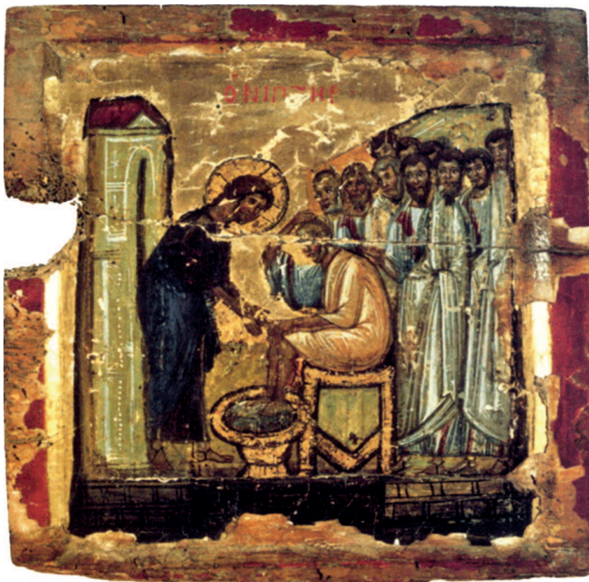
lavanda dei piedi -Icona di Santa Caterina del Sinai, sec. X

La retrospettiva sulla missione di Gesù, prepara e fonda l'altra dichiarazione di amore: « Li amò fino alla fine ». Il valore di questo verbo è "complessivo", come a sottolineare che quanto segue da questo momento, fino alla morte in croce, è un segno e una manifestazione d'amore; una vera epifania d'amore! E questa totale, suprema manifestazione dell'amore di Gesù si esprime nell'espressione greca eis telos , che, oltre e più del significato temporale (« fino alla fine ») svela il suo valore qualitativo: « fino all'estremo », o meglio « fino al [perfetto] compimento »! Gesù ama oltre ogni misura: « non c'è amore più grande di questo, dare la vita » (Gv 15,13). Nel supremo momento della morte, Gesù pronuncerà un'espressione quasi identica: « [tutto] è compiuto » (Gv 19,30). La vita donata per amore è giunta al compimento perfetto. « [Tutto] è compiuto » non significa « la fine è giunta », ma « la volontà del Padre, la sua opera, è stata realizzata, in tutto, e perfettamente ». Viene così tracciato un arco ideale tra la cena e la morte, in particolare tra il gesto di Cristo che lava