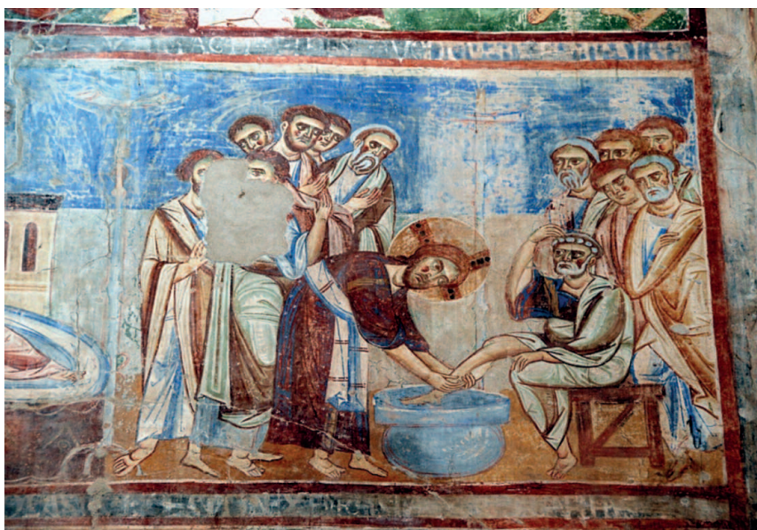
la lavanda dei piedi - Sant'Angelo in Formis

La prima annotazione è temporale, ma assai significativa: «Prima della festa di Pasqua». Nel Quarto Vangelo, la vita di Gesù, è scandita dalle grandi feste, in particolare da quella di Pasqua. Questa è la terza menzionata dall'Evangelista: la prima era stata citata in collegamento con il segno del nuovo tempio (Gv 2,13.23); la seconda era stata messa in relazione con il segno del pane di vita (Gv 6,4); la terza (Gv 11,55-12,1) è legata alla resurrezione di Lazzaro, che avviene «sei giorni prima della Pasqua»; la Pasqua in cui Gesù doveva essere messo a morte. Nelle prime due ricorrenze è specificato che si tratta della «Pasqua