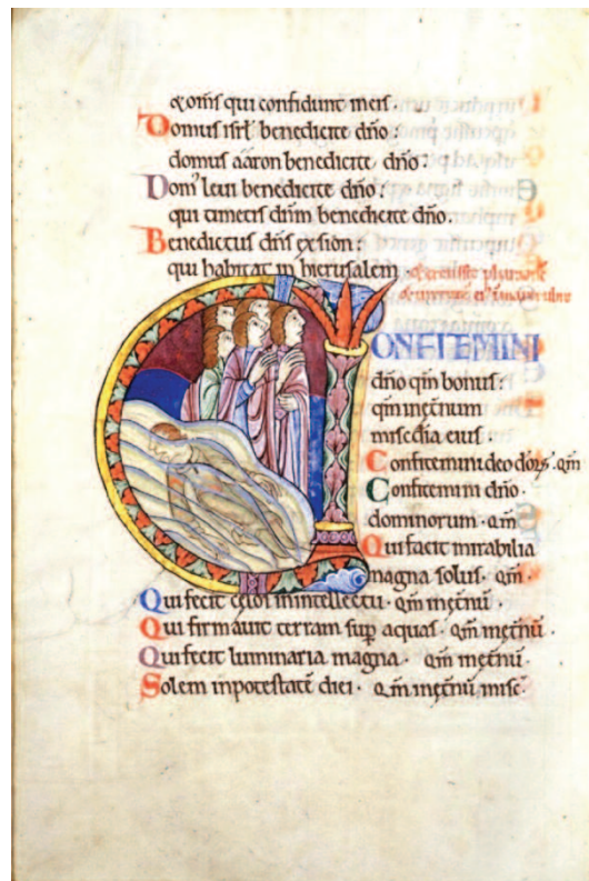
incipit del Salmo 136 - Salterio di St. Alban, f. 179r

Esso si presenta come una lunga litania, nella quale ad ogni attributo di Dio, ad ogni sua opera, fa seguito un refrain: «perché il suo amore è per sempre». Questa ripetizione, lungi dal rendere monotono il salmo, rafforza ed esalta l'ammirazione gioiosa di quanto il Signore ha operato e opera. È un ritornello che sintetizza il modo di agire di Dio verso gli uomini, riassunto nella parola misericordia ( hesed ), il termine che nell'Antico Testamento, come abbiamo visto, definisce l'alleanza che intercorre tra il Signore e il suo popolo, definendo gli atteggiamenti che si stabiliscono all'interno di questa relazione: la grazia, la bontà, la tenerezza, la premura, la costanza, la fedeltà, la lealtà, la benevolenza, l'amore... Tutti questi