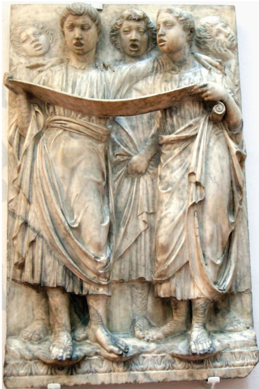
cantori - formella della Cantoria di Luca della Robbia, Firenze, Museo dell'Opera del Duomo

Se i verbi descrivono l'azione del loro autore, le opere sono « grandi meraviglie » (v. 4), che fanno riferimento all'intera sequenza degli interventi salvifici di Dio, rappresentati dai tre articoli di fede che G. von Rad ha definito il « piccolo credo storico di Israele »: la creazione (vv. 4-9), la liberazione nell'esodo e nel deserto (vv. 10-20), il dono della terra pro-