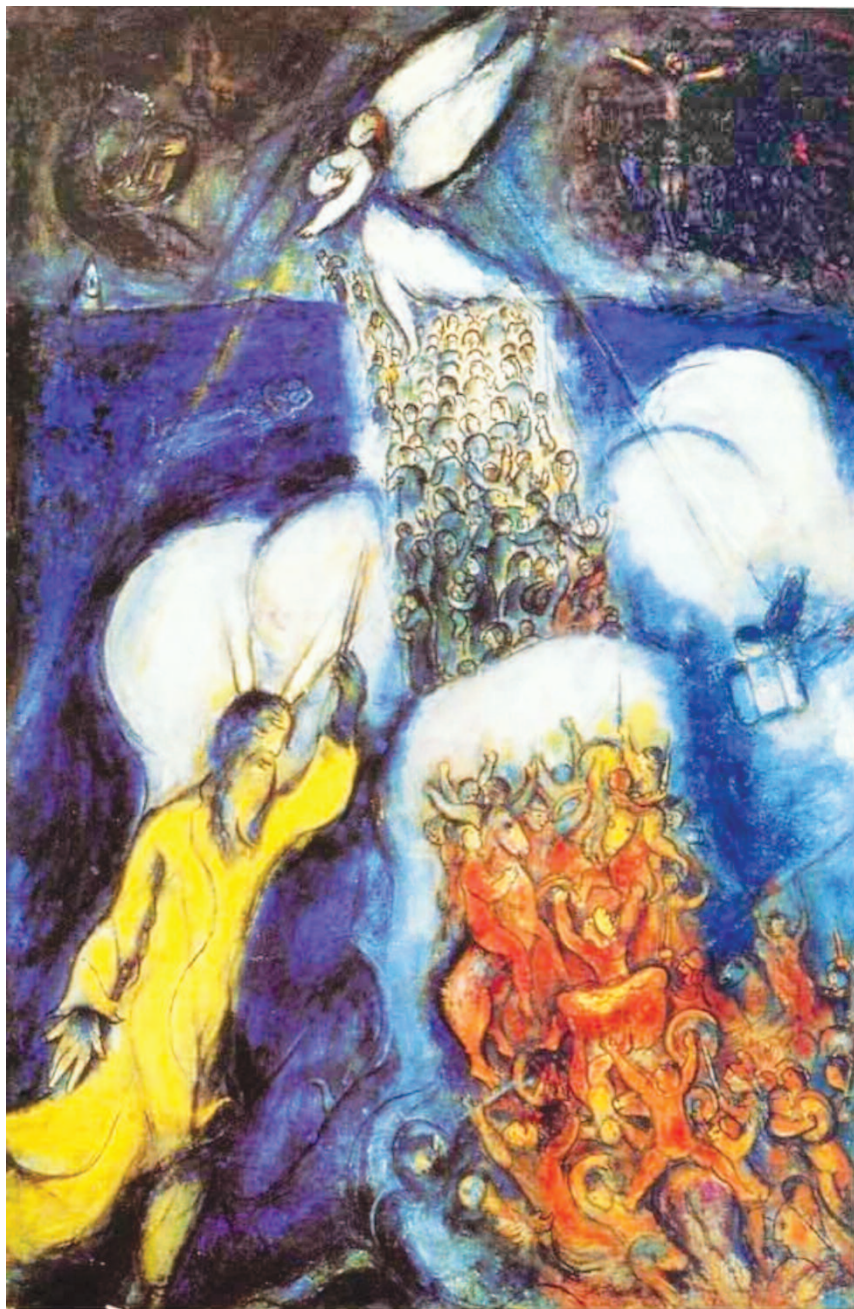
Marc Chagall, Il passaggio del Mar Rosso (1955) - Parigi, Centre George Pompidou

Ecco dunque che tutto è posto sotto il segno della misericordia , dell'amore salvifico; tutto è, cioè, salvezza. Essa ha inizio con la creazione dell'universo, continua con la redenzione di Israele e prosegue nel-