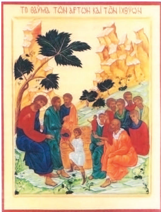
la moltiplicazione dei pani - icona moderna

manifestazione del suo amore salvifico e fedele, della sua grazia, della sua misericordia. Ogni azione (la storia) e ogni opera (la creazione) rivelano la misericordia di Dio non solo come qualità presente nell'evento ma come forza che lo trascende. Tutto concorre a svelare una stessa ed unica misericordia; tutto ha un senso ultimo complessivo, unitario che è la bontà di Dio verso l'uomo.