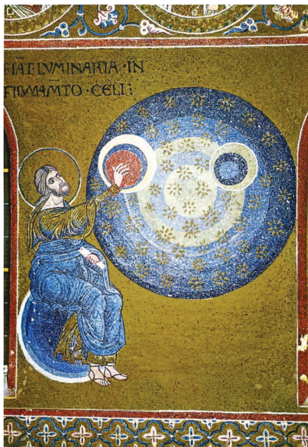
il quarto giorno della creazione - Duomo di Monreale

Il salmo avrebbe potuto concludersi qui, con il dono della terra, il punto di arrivo del cammino di liberazione. Il salmo, invece, prosegue, riassumendo gli eventi storici accaduti nella terra promessa, ma questa volta senza alcun riferimento cronologico concreto. Dai fatti dell'esodo, gli eventi di liberazione si estendono in tal modo a tutti i tempi. Al per sempre . Se fino ad ora le opere del