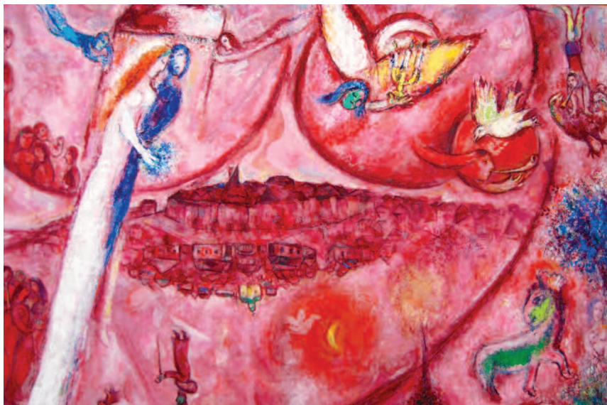
Marc Chagall - Cantico dei cantici - La bellezza nella bibbia appare quindi come la "firma" della gratuità divina e umana e nel Cantico essa si presenta come superamento della solitudine, come esperienza di unità

Lo sfondo rimane quello del Cantico dei Cantici che in questa terza parte richiama ancora al principio della bellezza, cui tutto il processo formativo deve far riferimento.