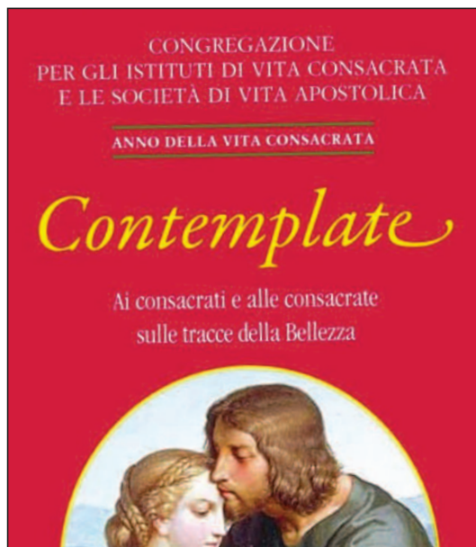
terza lettera circolare nell'Anno della Vita Consacrata dal titolo Contemplate

Interessante, nel documento, l'invito finale, che mi pare di grande attualità e prospettiva: