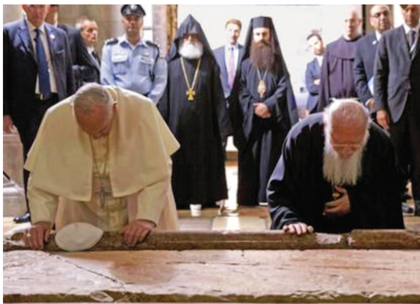
papa Francesco a Gerusalemme prega col Patriarca Bartolomeo nella basilica del s. Sepolcro (2014)

Lutero fa notare che «vi sono alcuni che onorano e pregano Dio e i Santi soltanto per essere liberati dal male e non cercano altro, non pensano neppure alle prime richieste per dare la precedenza all'onore, al nome e alla volontà di Dio. Essi cercano la loro volontà e capovolgono questa preghiera, cominciando con le ultime richieste e non giungono mai alle prime». Ma onestamente è preferibile «desiderare di essere liberati dal male