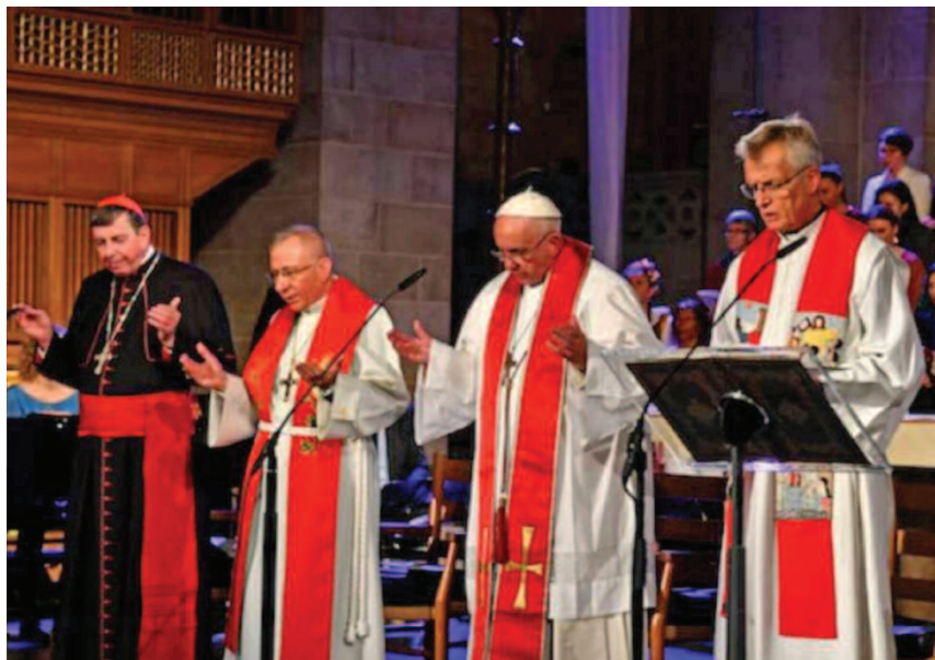
papa Francesco prega il Padre nostro nella cattedrale luterana di LUND (2016)