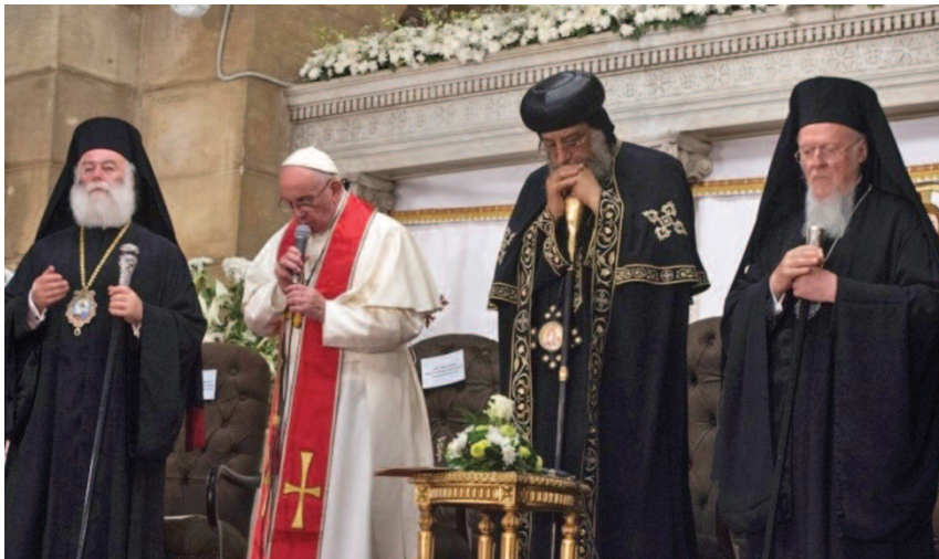
Egitto - preghiera ecumenica, 28 aprile 2017

Tertulliano lo definiva « breviarium totius Evangelii », Vangelo abbreviato, cioè sintesi di tutto il Vangelo, che precede ogni divisione tra le Chiese . Pregarlo è come risalire alle sorgenti dell'unità, con anelito ecumenico, quando chiediamo in particolare: « Padre, sia fatta la tua volontà in cielo e in terra ». La volontà del Padre, rivelata da Gesù (Gv 17), è l'unità