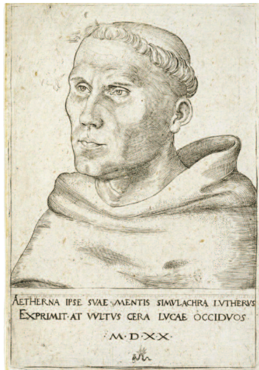
Lutero in abito di religioso agostiniano