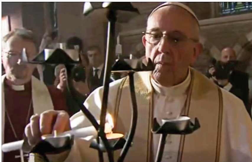
papa Francesco nella chiesa anglicana di Roma (2017)

per anteporre invece la volontà di Dio che è soltanto volontà di bene. Nelle preghiere introduttive per disporsi alla recita del Padre nostro , Lutero chiede a Dio di difenderci da ogni volontà cattiva, ribelle, ostinata e di donarci una obbedienza retta, conforme alla sua volontà, per vivere più sereni e in pace tra noi, invocandolo ad esempio di preservarci « dal vizio orribile di parlare, calunniare, diffamare, giudicare, condannare e rimproverare gli altri. Che si allontanano da noi la grande disgrazia e la terribile piaga di lingue simili ». Lo « sparlacciare » turbava il nostro Santo (Serm.4) e papa Francesco insiste nel mettere in guardia dal « terrorismo delle chiacchiere ». Lutero evidenzia inoltre che « in questa preghiera Dio ci comanda di pregare contro noi stessi, mentre ci insegna che non abbiamo nemico maggiore di noi stessi ». E conclude pregando: « Padre, non lasciarmi cadere nella tentazione di volere che le cose vadano secondo la mia volontà. Spezza la mia volontà ».