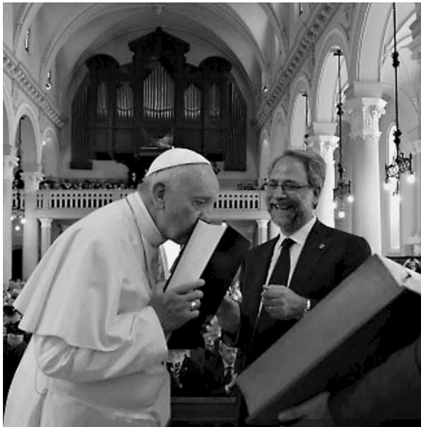
papa Francesco nel tempio valdese di Torino (2015)

che « il pane, la parola e l'alimento non è altro che Gesù Cristo stesso che ha detto 'io sono il pane vivo' e