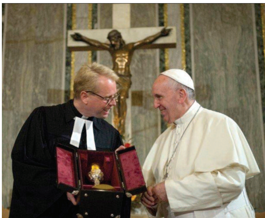
papa Francesco nella chiesa luterana di Roma (2015)

sia fatta la tua volontà come in cielo così anche in terra