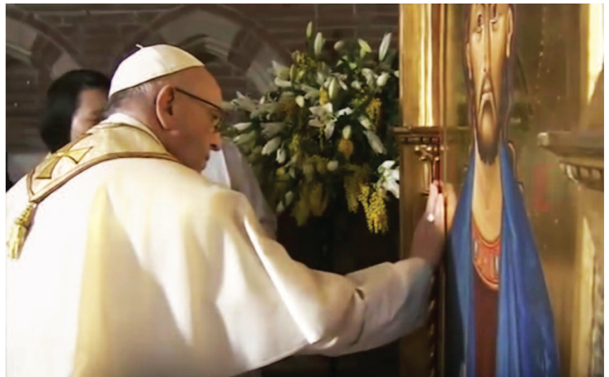
chiesa anglicana di Roma - papa Francesco benedice l'icona di Cristo Salvatore

riori agli altri, giudicandoli: «questo significa rubare il nome e l'onore di Dio per attribuirli a se stessi. Il nome di Dio soltanto è santo, pio, buono; davanti a Dio noi tutti siamo ugualmente peccatori, l'uno come l'altro, senza distinzione». Vi sono persone malsane, indipendenti, senza timore di Dio, che bestemmiano e profanano il suo nome quando si ritengono buone, esemplari, migliori degli altri: «lo chiamo costoro i santi orgogliosi e martiri del diavolo ». Come se essi stessi non fossero peccatori e malvagi, non vogliono avere a che fare con loro. «Dobbiamo pregare e bramare seriamente, finché viviamo, che Dio santifichi in noi il suo nome . Questa pre-