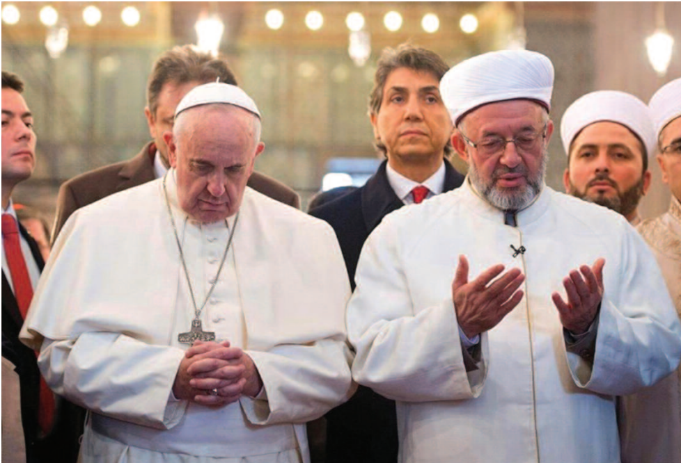
papa Francesco prega nella Moschea Blu di Istanbul (2014)

«quelli che sembrano pregare di più, pregano meno di tutti; e viceversa quelli che sembrano pregare di meno, sono quelli che pregano di più», in silenzio, senza interruzione, ad esempio anche durante il lavoro. Quanto alla preghiera orale, certamente da non sottovalutare, «occorre attenersi alle parole e salire con esse , finché non siano cresciute le ali per volare senza le parole». Inoltre Gesù «non vuole che ognuno preghi per sé soltanto, ma per tutti gli uomini. Egli non ci insegna a dire 'Padre mio', ma 'Padre nostro' . Poiché se egli è il Padre di tutti, vuole che siamo fratelli tra di noi e ci amiamo di cuore e preghiamo gli uni per gli altri come per noi stessi».