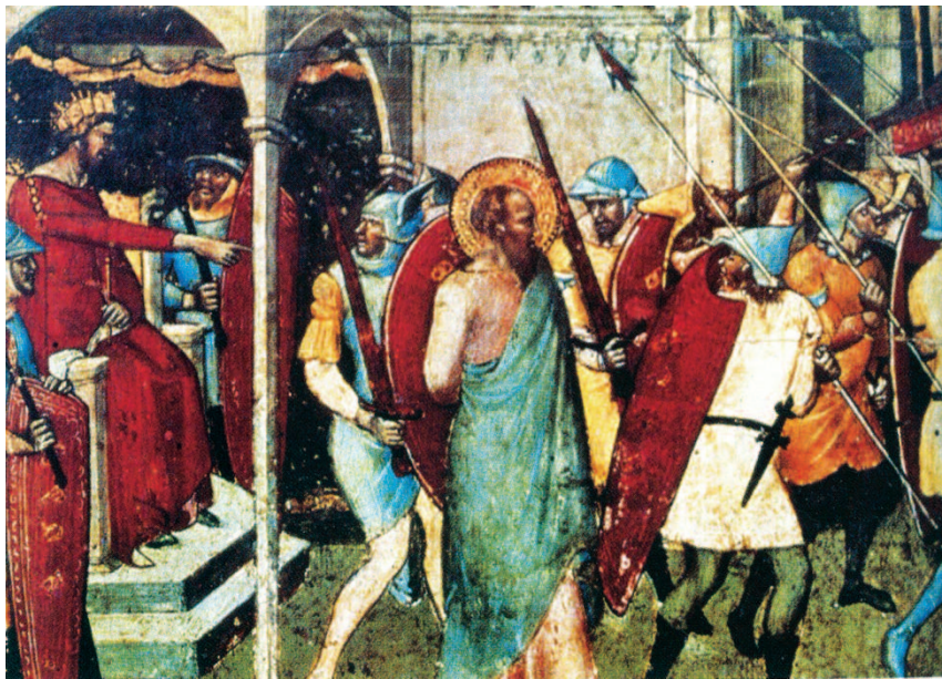
Paolo davanti al giudice Festo (part.). Dipinto su tavola, pittore ignoto (sec. XVI). Bolzano, Abbazia Novacella

La fisiognomica, dunque, è lo studio di ciò che si mostra all'esterno, che a sua volta parla di ciò che sta all'interno. La fisiognomica è quindi lo studio del carattere umano sulla base di come si appare e di come si agisce (p. 121). È sorprendente co-