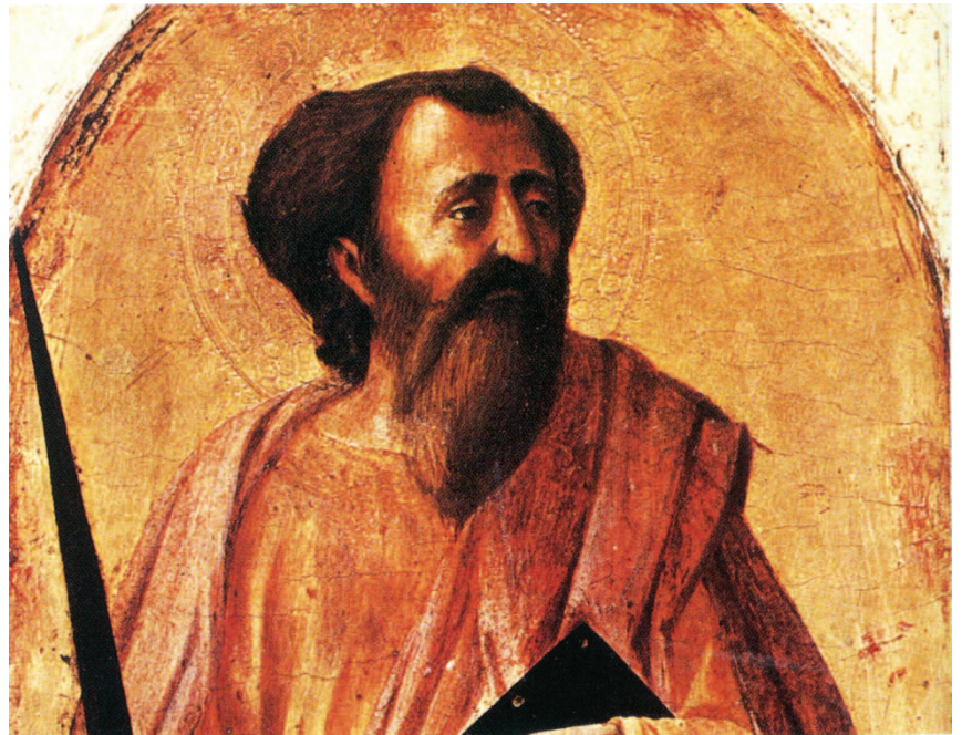
Paolo. Olio su tavola. Masaccio (1401-1428). Pisa, Museo Nazionale di S. Matteo

di diffuse ripetizioni (probabilmente dovute alla scrittura a quattro mani). Ma i frutti che se ne ricavano non corrispondono alla fatica della lettura. Se per un lettore nordamericano può essere di qualche utilità, perché sfata il presupposto di una concezione esclusivamente psicologista della personalità, per un lettore europeo, dalla mentalità più storica e dalla cultura più classica, le conclusioni (fondamentalmente: essere la persona integrata nel gruppo ed avere una percezione di sé nello spazio geografico e nel tempo della propria famiglia sto-