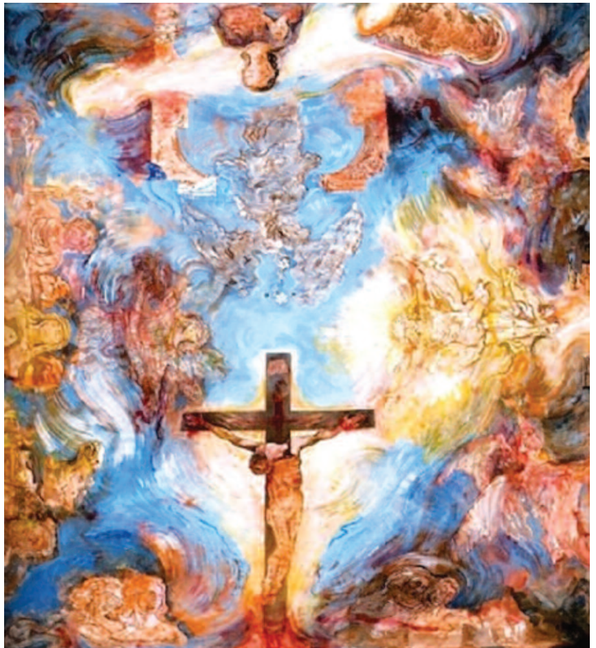
Paolo Baratella: Storia della salvezza - sacrestia della cattedrale di Ferrara

Noi che possediamo il senso pieno del termine, perché sappiamo che l'Emmanuele è Gesù, come chiaramente ci insegna Mt 1,18-23, e che