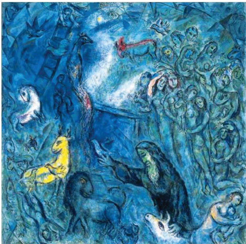
L'arca di Noè - M. Chagall

Il titolo divino e messianico che meglio sintetizza le prerogative di Gesù e che lo stesso Gesù si attribuisce apertamente, è quello di « Figlio dell'Uomo ». Nei sinottici si presenta in modo insistente, cominciando dalla professione di fede di Pietro che lo dichiara « Messia, Figlio di Dio ». È bene subito notare che la professione di Pietro è l'inizio di un cammino verso la rivelazione ultima che Gesù ci farà della sua condizione nella Vita trinitaria, perché, nel momento della professione di fede del discepolo, i termini « Messia » e « Figlio di Dio » sono sinonimi. Costatiamo, di fatto, che è in Giovanni che Gesù, di sua iniziativa, annuncia la sua condizione divina di Figlio alla quale mai gli Apostoli sarebbero arrivati per se stessi. In Giovanni, il titolo di « Figlio dell'Uomo » presenta in sé, fin dall'inizio, le condizioni divine del messia, la « Gloria di lavè » di Ezechiele (Ez 1,26-28). Di fatto, vuol essere il tema di tutta la catechesi del vangelo dell'Apostolo (Gv 1,51).