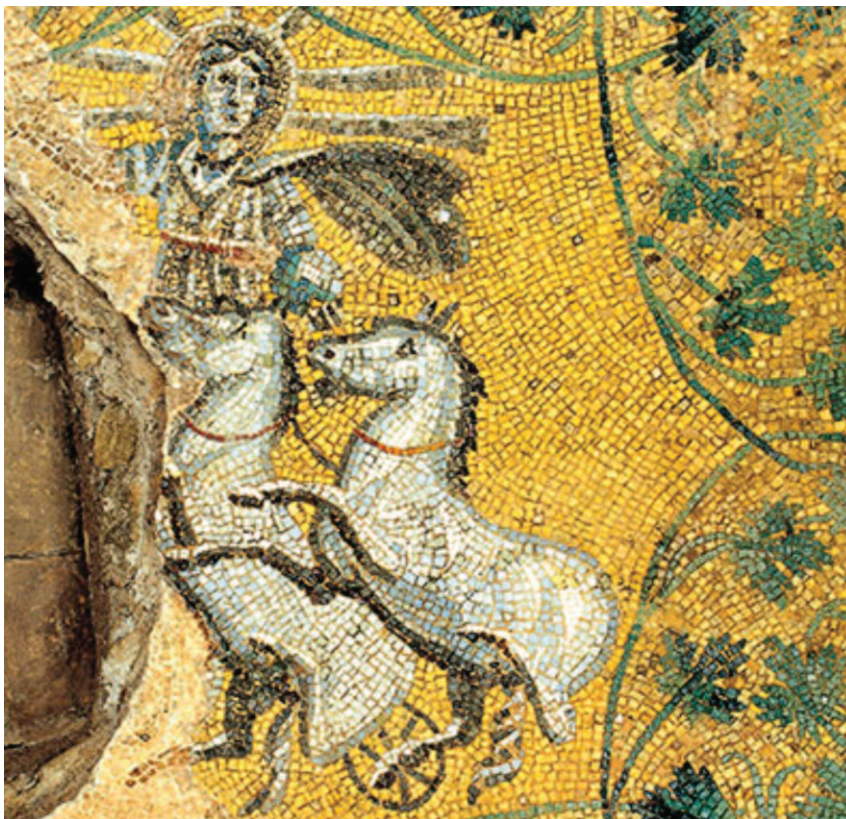
Cristo sole - Mausoleo dei Giuli sec II - Scavi Vaticani

Gesù è la Sapienza che fu giustificata dalle sue opere (Mt 11,19). «Più bella del sole» (Sap 7,29) «si estende da un confine all'altro con forza, governa con bontà eccellente ogni cosa» (8,1).