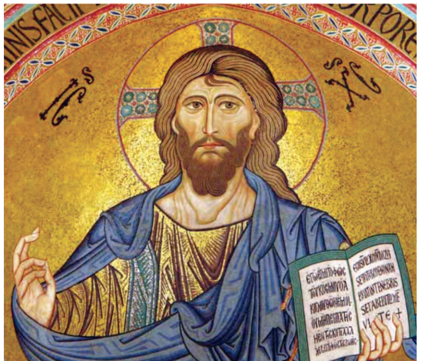
Cristo Pantocratore - Cappella Palatina del Palazzo dei Normanni a Palermo - la catechesi apostolica ci insegna a interpretare cristologicamente le figure profetiche della Scrittura

to, associa a questo titolo due titoli eminentemente divini: «Irradiazione della gloria di Dio, immagine del suo Essere» (Hb 1,3; cf. Sab 7,26), per presentarci Gesù nella condizione di Figlio che «realizzata la purificazione dei peccati, si è seduto alla destra della Maestà» (ibid.). È chi l'Apocalisse presenta ricevendo la stessa adorazione dalla corte celeste, seduto alla destra di Dio. Attraverso queste figure della redenzione e della glorificazione di Gesù, vediamo sintetizzata la maniera secondo la quale la Divinità volle farsi conoscere dagli uomini. Si tratta di una forma sapientissima il cui significato, come abbiamo potuto notare, è gradualmente completato attraverso immagini del linguaggio figurativo della Bibbia.