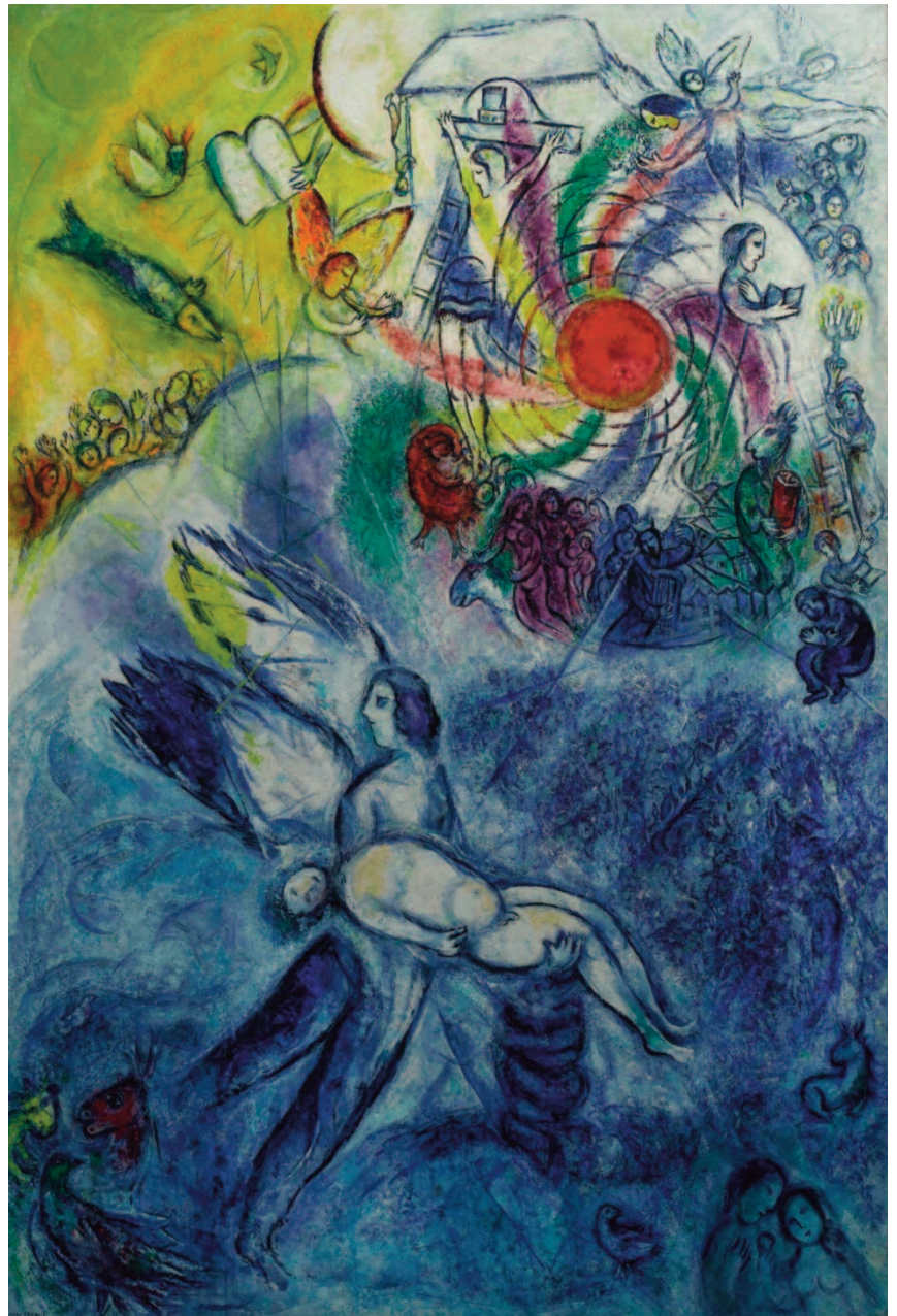
la creazione dell'uomo

Di fronte a tutto ciò risulta evidente che l'argomentazione della prefazione della Bibbia, Gen 1-11, è una riflessione teologica che vuole presentare il piano di Dio, che è quello di chiamare l'uomo alla partecipazione della sua vita. A questo fine è stabilita, con la narrativa della creazione dell'uomo, una distinzione puramente logica, in rapporto all'uo-