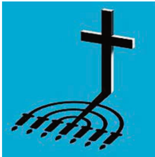
la croce e la menorah

di Dio, come pure di prestargli il dovuto culto di lode. Lo sbaglio provocò nella storia dell'umanità l'iniziativa di Dio di intervenire, con misericordia, nella vita dell'uomo. Il risultato di questa combinazione di colpa da parte dell'uomo e di fedeltà alla sua bontà, da parte di Dio, fu la redenzione. Nulla può essere più sorprendente, considerando il modo col quale si realizzò. Fu completamente impreveduto il fatto che la redenzione avvenisse attraverso un'appropriazione della natura umana da parte della vita divina. Con l'incarnazione avviene la meraviglia di una nuova creazione per la quale la filiazione divina diventa il destino dell'uomo, al fine di regnare con