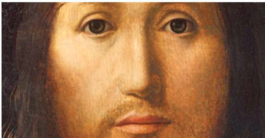
Antonello da Messina: Salvator mundi (dett.) - Dio che sfugge completamente a qualsiasi possibilità di essere capito, nella sua natura, è quello che ci chiama a riconoscerlo in Cristo

I profeti parlano di questo Dio presentandolo come l'unico Dio esistente. La rivelazione che avviene con Gesù Cristo approfondisce la comprensione della sua natura. Gesù Cristo la attua iniziando dalla sua persona che, poiché ha assunto con l'incarnazione la natura umana, si relazione con il Dio creatore invocandolo come suo padre. Al concetto di Creatore che già lo rivelano onnipotente, sapiente, perfetto e buono, somma il concetto di misericordioso, cioè presenta Dio come la bontà che fedele a se stessa