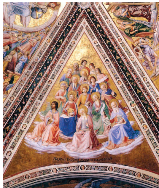
Beato Angelico: il coro dei profeti - la profezia veterotestamentaria ha svolto un ruolo importantissimo della comprensione della natura divina

zione dell'autore del libro della Sapienza l'informazione di una condizione personale della Sapienza che è l'artefice di tutta la creazione nella condizione di parola che pronunciata da Dio dà origine, nella forza dello Spirito, a tutte le cose. In questo