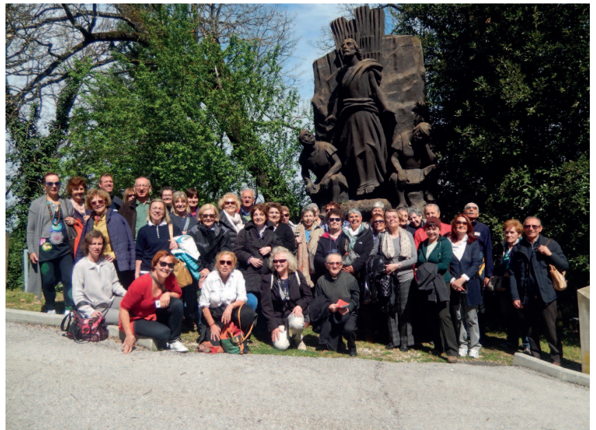
Collevalenza - foto di gruppo al termine della Via Crucis