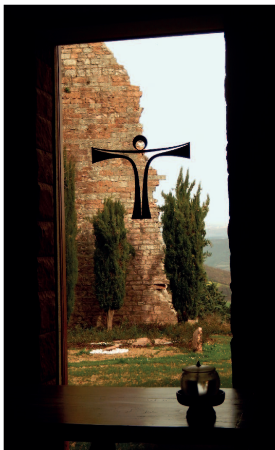
Collepino - cappella dell'Eremo della Trasfigurazione