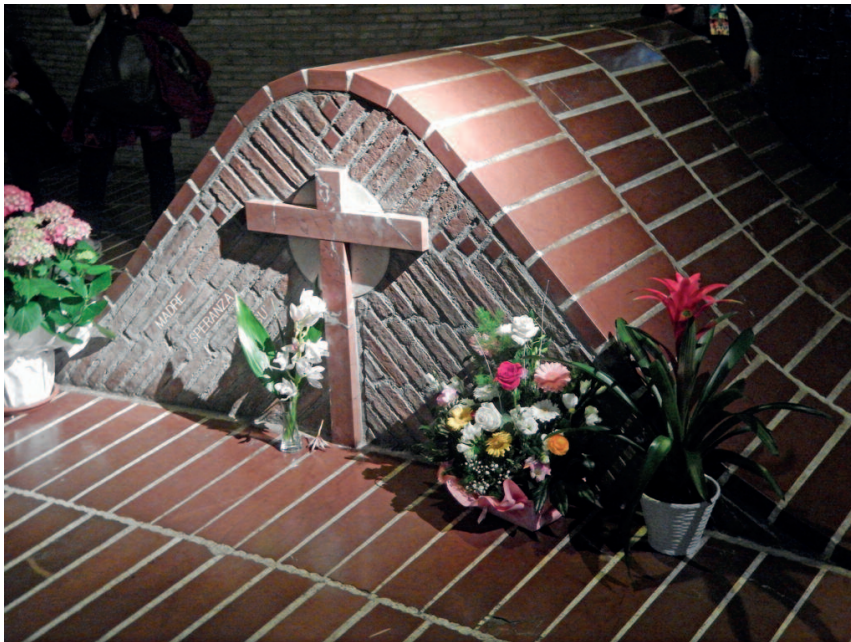
Collevalenza - tomba della beata Madre Speranza

del silenzio, dimensione peculiare dell'eremo. Lì partecipiamo alla santa Messa prefestiva della domenica della Divina Misericordia e l'omelia è ancora una volta sintesi illuminante del nostro cammino, di quello fatto e di quello che ci attende. La visita alla cripta è sentita con emozione da molti e qualcuno si rammarica di non potervi sostare: vi si respira un'atmosfera di grande spiritualità.