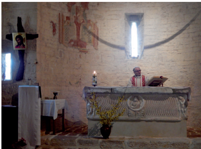
Collepino - chiesa dell'Eremo della Trasfigurazione

Il luogo attira la nostra attenzione e suscita tante domande su come si potesse vivere qui, in questi anfratti anneriti dal fumo, tra due monti alti, che sembrano lasciarti solo un brandello di cielo, in una zona boscosa che odora di muschio, con una chiesetta che ha una parete nella roccia, con l'unica compagnia di un ruscello e di una cascata. Quando ci affacciamo a una delle grotte, dubbi e interrogativi crescono: sono luoghi veramente angusti e impressionanti.