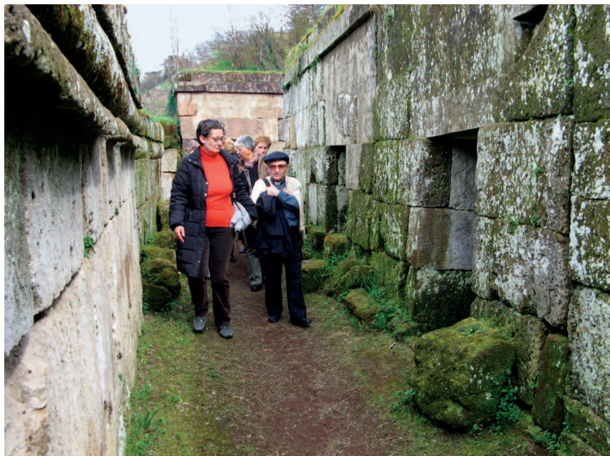
Orvieto - necropoli Crocifisso del tufo

Descrivere il Duomo di Orvieto qui è impossibile e forse inutile, tanto è conosciuto, ma non può mancare un accenno alla Cappella del Corporale. Gli affreschi, opera di pittori orvietani, tra cui Ugolino di Prete Ilario,