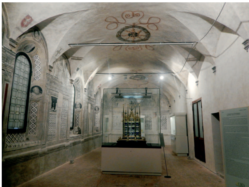
Orvieto - Museo del duomo - Libreria Albèri

Anche nella conoscenza di questa interessante civiltà non mancano nuove scoperte accanto alle conferme: le necropoli, il percorso archeologico sotterraneo (che ci aveva catturato a Perugia!), i musei e le loro preziose collezioni, le strade in cui è piacevole passeggiare, gustando l'atmosfera del tessuto urbano e sco-