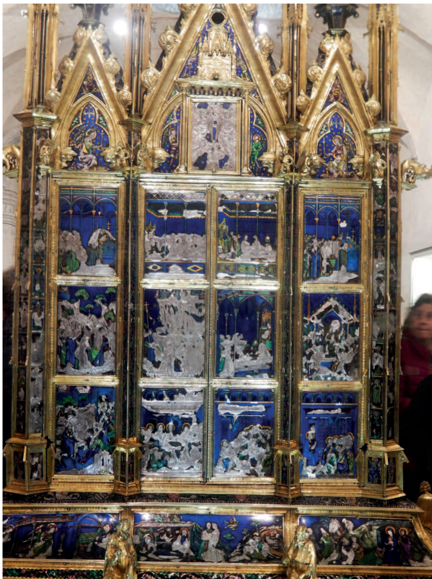
Orvieto - Museo del duomo - reliquiario del corporale di Bolsena

Certo le pitture della cappella di San Brizio ci avevano stupito e cattu-