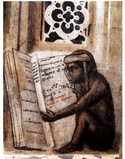
Orvieto - Libreria Albèri - scimmietta occhialuta

Certamente nell'Umbria delle città e dei borghi meno noti, ma non meno ricchi di fascino, avremmo potuto tro-