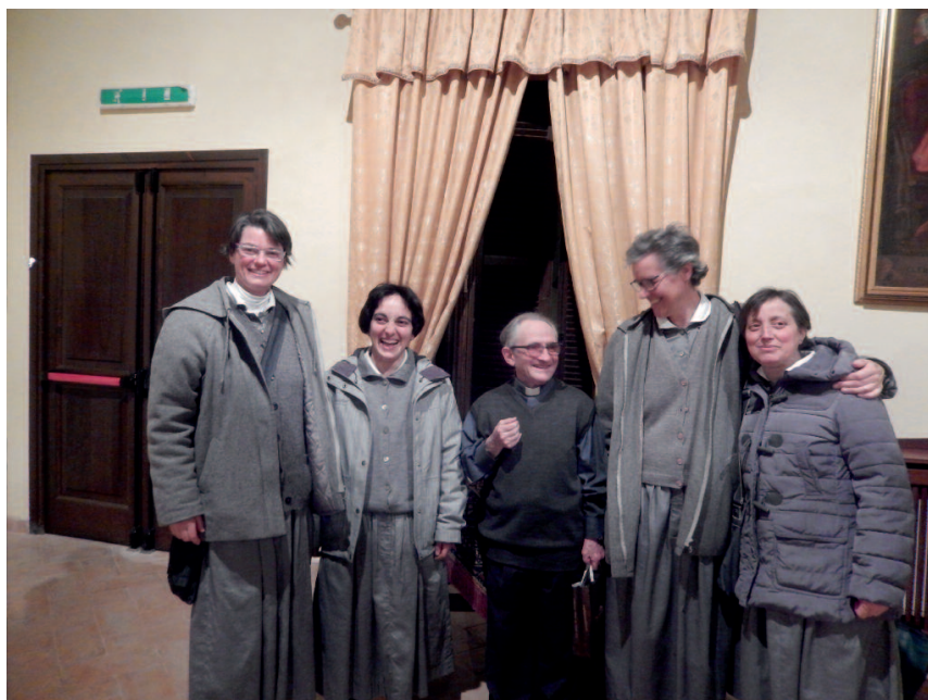
Campello - incontro con le Allodole