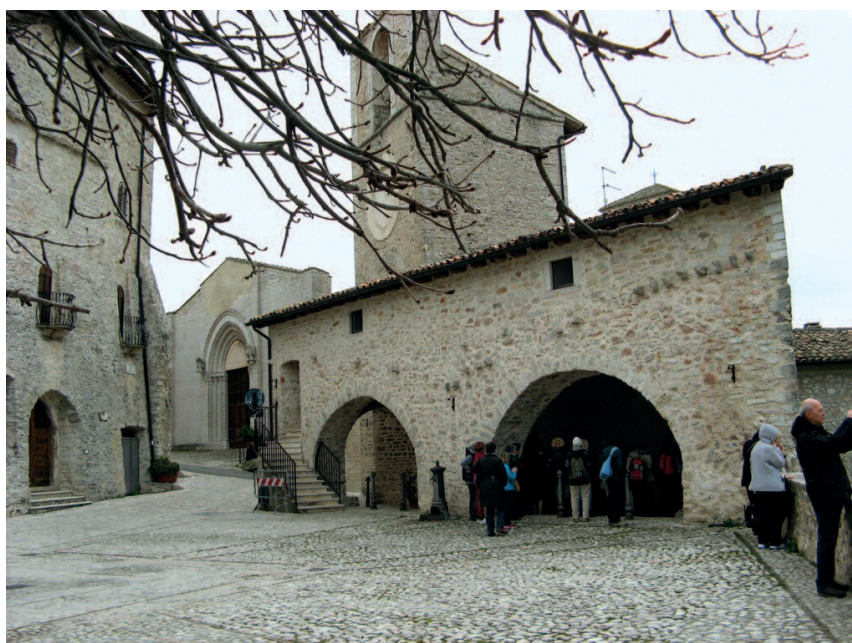
Monteleone - portico adiacente la chiesa