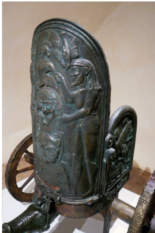
Monteleone - la biga (dett.)

Il cibo: lo abbiamo sentito non solo come piacere, ma come convivialità preziosa e come "energia per la vita" da gustare, assaporare, senza abbuffarsi. Scoprire il valore profondo del cibo significa rendersi conto che è espressione di una cultura e