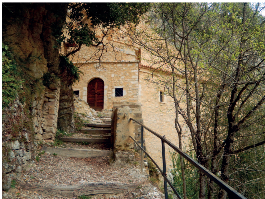
Poggiodomo - Eremo Madonna della Stella