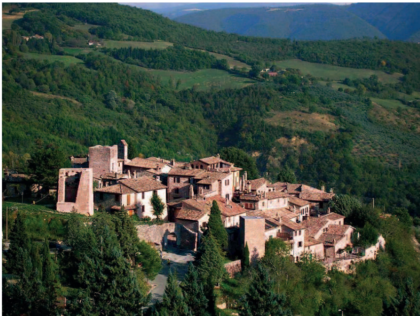
Collepio - panorama

Un cibo semplice, ma di gusto squisito è il farro e qui c'è l'unica Dop per questo cereale, abituale sulla tavola di Etruschi e Romani, ma risalente addirittura al 7000 a.C. nella Mezzaluna fertile. Lo gustiamo all'Hotel Brufa in un lauto pranzo, che ci assicura nuove energie e il solito gradito momento di convivialità.