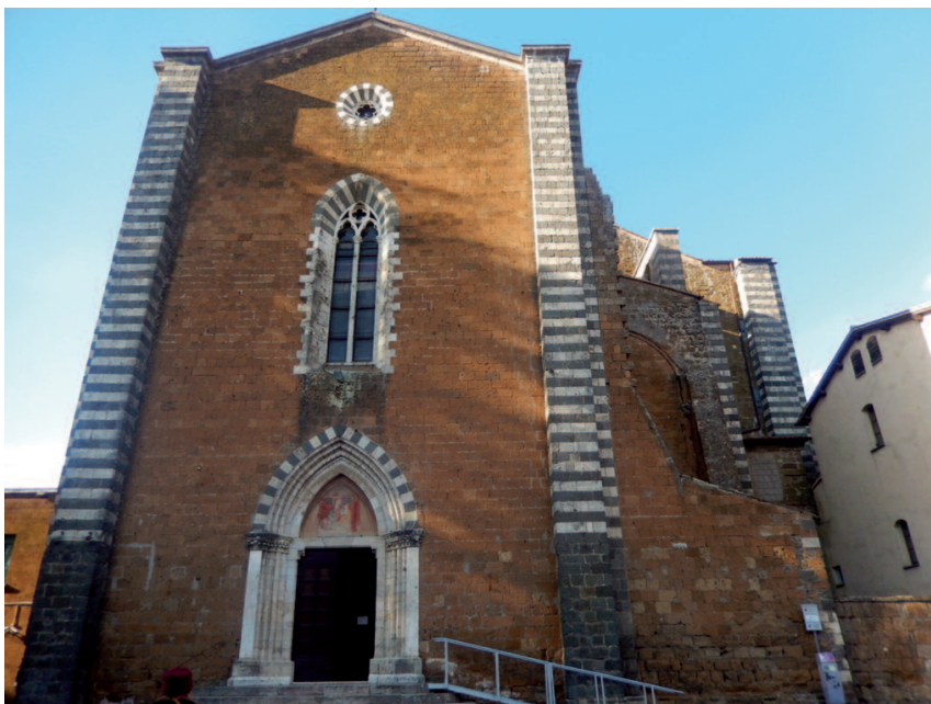
Orvieto - chiesa di S. Domenico