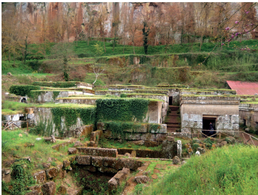
Orvieto - panoramica della necropoli Crocifisso del tufo

Forse non molti sanno dell'esistenza di un' Accademia del silenzio e che proprio nel Convento dei padri barnabiti a Campello terrà l'annuale appuntamento sotto la guida di Duccio Demetrio. « È il silenzio che ci fa aggiustare i fili e le parole del nostro esserci nella Creazione e tessere gli alfabeti di vita e di amore che ci ricongiungono all'Assoluto ». Il silenzio come trama e ordito dell'esistenza è un'immagine veramente originale e carica di senso. La riprenderemo per-