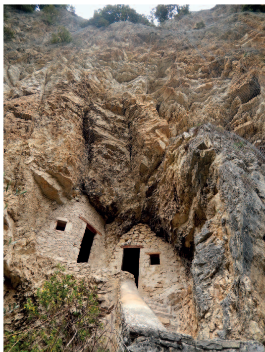
Poggiodomo - Eremo Madonna della Stella - la rupe