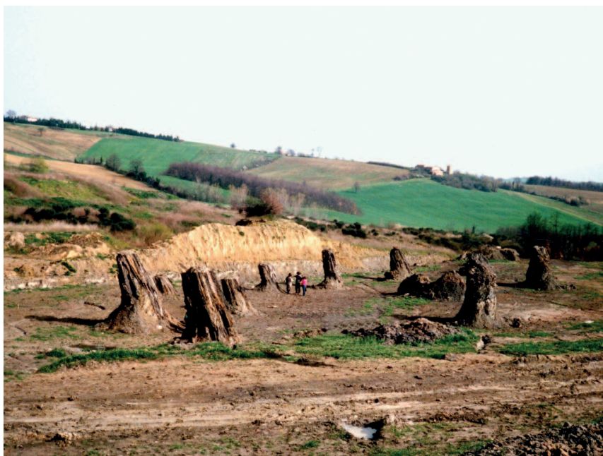
Dunarobba - Foresta fossile

non solo di un luogo: qui in Umbria siamo consapevoli di come sia giusto parlare di sapori e di saperi. Anche nella gastronomia coesistono innovazione e tradizione, cibi del passato che vengono rivisitati alla luce di esigenze e conoscenze nuove. Presidi slow food, tour enogastronomici, corsi di cucina creativa, sagre originali sono presenti in tutta la regione.