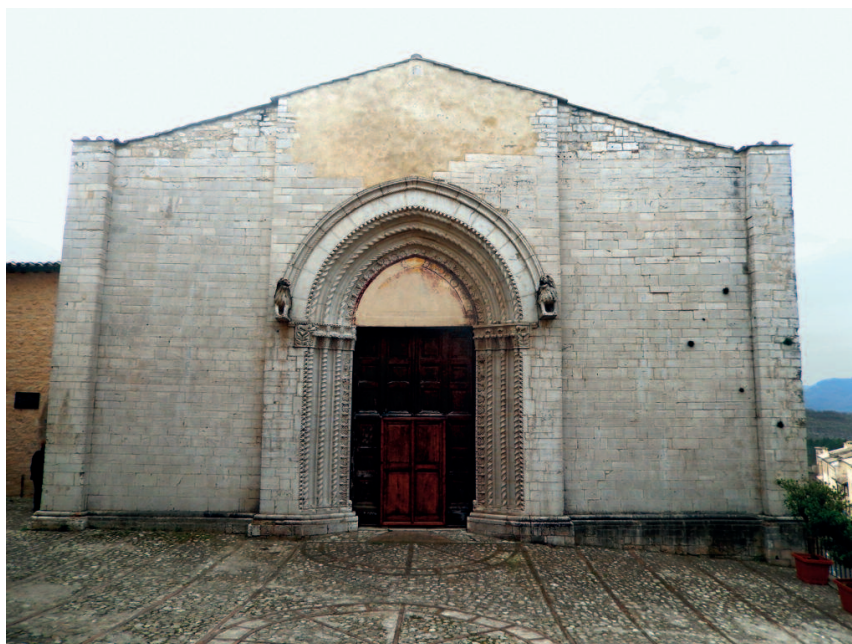
Monteleone - chiesa di S. Francesco

Anche le Allodole sono da noi e insieme viviamo una serata per raccogliere le loro firme sul libro dedicato a Sorella Maria. Un momento di vera festa per lo spirito. Penso al le-