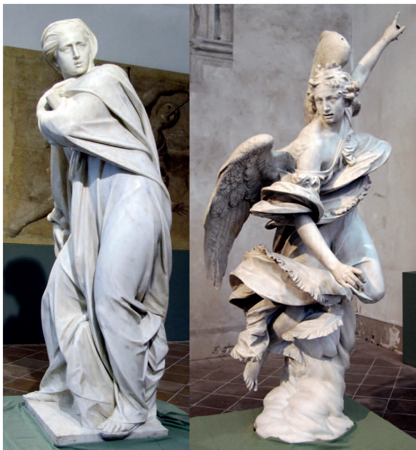
Orvieto - chiesa di S. Agostino - Francesco Mochi: Annunciazione 1603-05 (angelo) 1605-08 (vergine)

Era stata la richiesta espressa da Rosaria e condivisa da molti: medi-