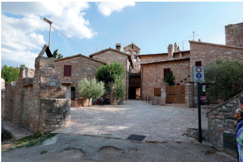
Collepio - scorcio