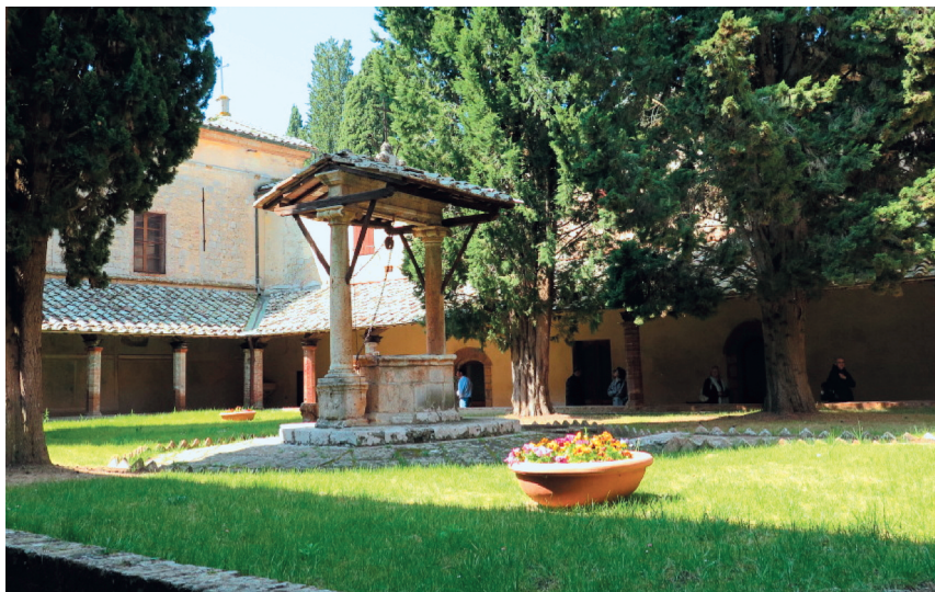
Eremo di Lecceto - il chiostro