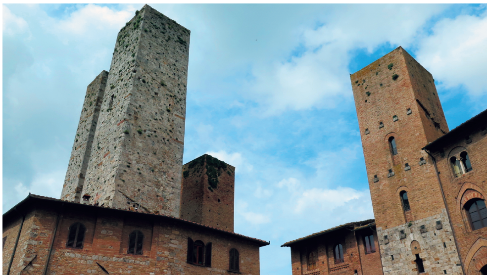
torri a S. Gimignano

che raccontano l'Antico Testamento. Che fortuna fruire di una simile opportunità! Nella Collegiata siamo conquistati dalla bellezza della cappella di Santa Fina, che è un vero gioiello rinascimentale, con due affreschi del Ghirlandaio, che li realizzò insieme al fratello e al cognato e che rappresentano le esequie della santa, con scorci di splendido paesaggio costellato di torri. Sarebbe da sottolineare ogni particolare degli affreschi, che dicono gli eventi miracolosi fioriti intorno alla giovanissima Fina: il chierichetto cieco che riprende a vedere, la nutrice che riacquista l'uso della mano