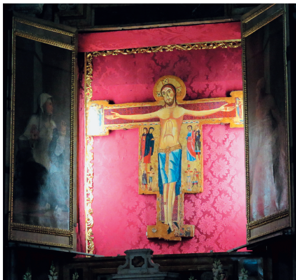
Siena: il Crocississo che ha parlato a S. Caterina

Poco fa, aprendo "Luoghi dell'infinito", il magnifico supplemento di "Avvenire", trovo, gradita coincidenza, un'immagine che pubblicizza con l'espressione "Divina Bellezza" la visita del pavimento, capolavoro da scoprire. Da agosto a ottobre apposite visite guidate offriranno questa opportunità, che per noi è molto gradita.