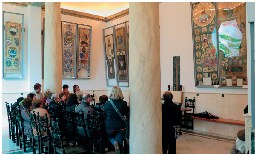
Siena: incontro alla Contrada dell'Oca