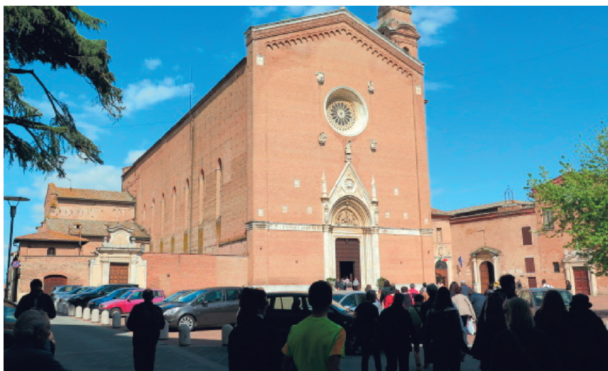
chiesa di S. Francesco, nota per la cappella delle "sacre particole"

La nostra intensa giornata prevede ancora la visita della chiesa di Santa Maria dei Servi, risalente al XIII secolo, in cui ci colpiscono due dipinti, uno dei quali raffigura un miracolo attribuito a Giocchino Piccolomini: egli ottiene la guarigione di (un bimbo o di un padre) epilettico offrendo di assumere il morbo su di sé. L'altro, l'opera più originale e significativa, è un'antica icona che raffigura la Madonna con il Figlio assisa in trono. Molto interessante è