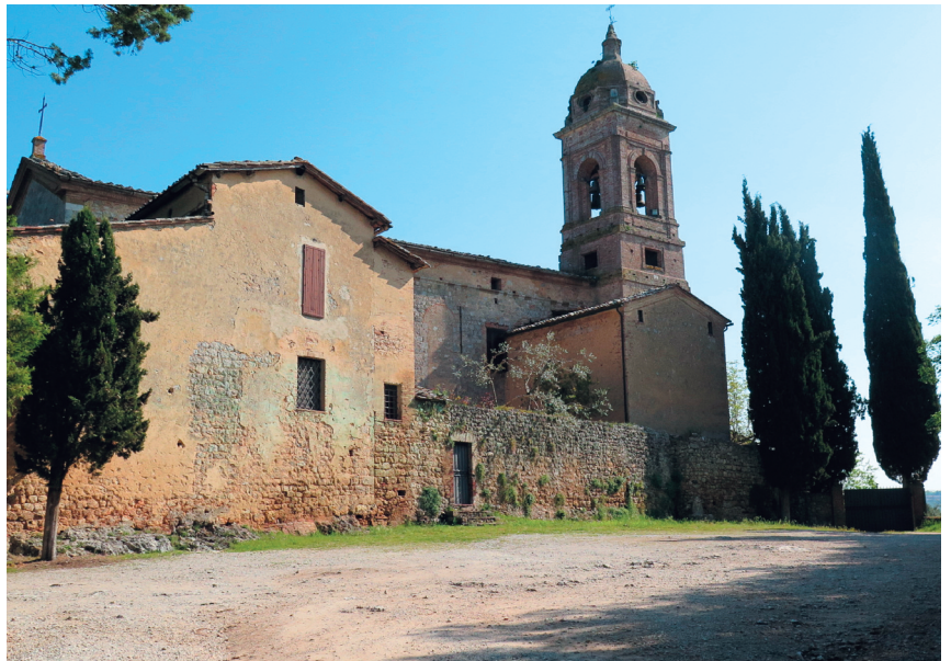
Eremo di Lecceto - esterno