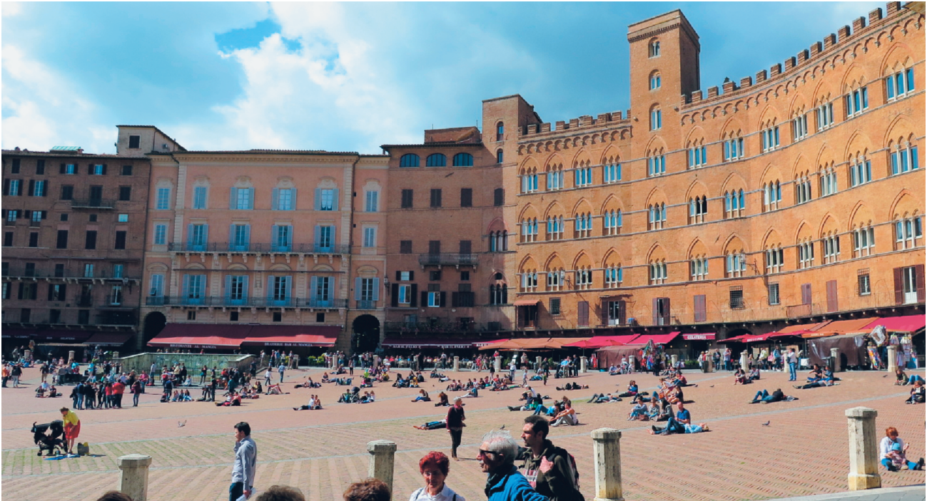
Siena: la splendida piazza

anchilosata, le campane mosse da mano angeliche. Nel tabernacolo è gelosamente custodito un prezioso busto reliquiario di artista senese del Trecento, che sembra riunire pittura, scultura, oreficeria e con cui ogni anno viene benedetta la città che le ha dato i natali e in cui morì a soli quindici anni. La sua memoria è comunque rimasta molto viva, forse anche per il prodigio delle viole che fioriscono sulla tavola di quercia dopo la morte di Fina, che vi aveva trascorso il lungo periodo della malattia, e che ancora fioriscono tra i muri delle torri, o per l'ospedale che fu costruito con lasciti e offerte dei fedeli o ancora per opere letterarie e musicali che la ricordano.