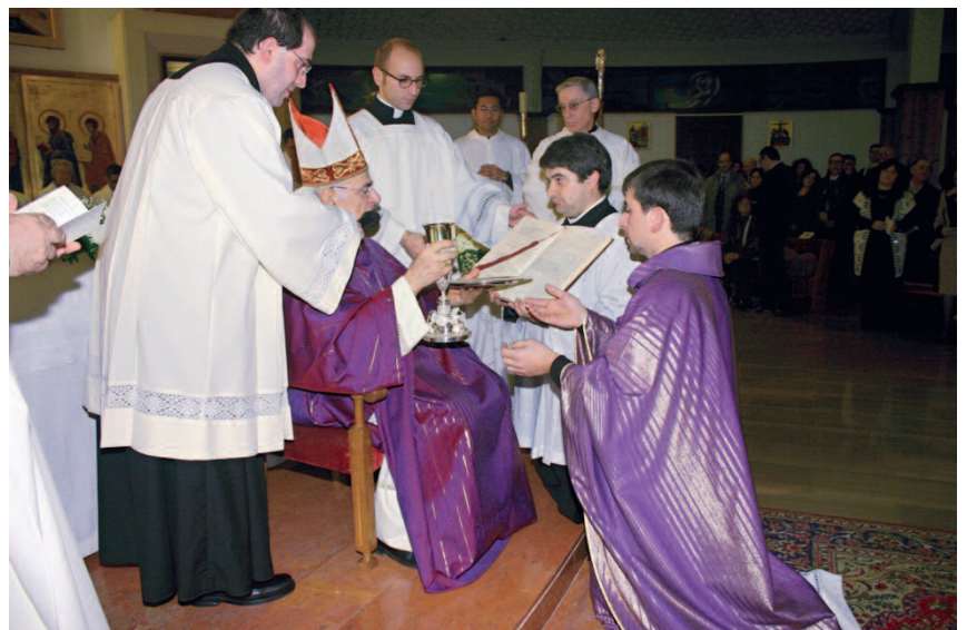
la consegna del calice