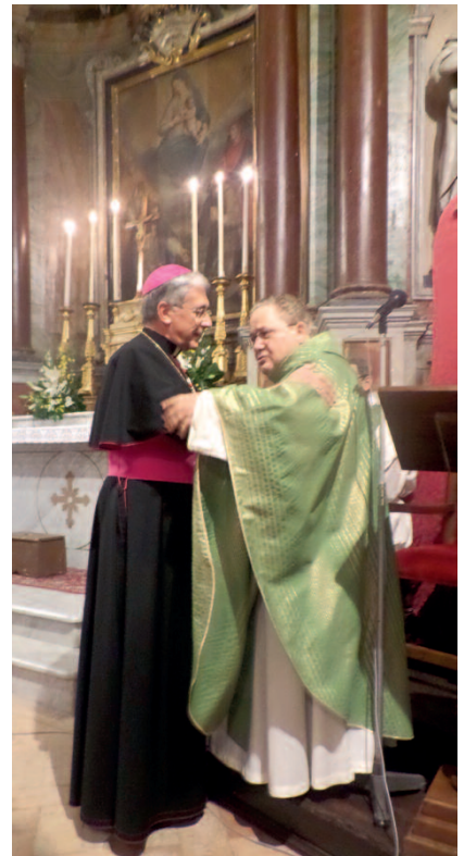
L'abbraccio tra i due Pastori

non ultima, la Vergine santissima, venerata anche con il Titolo di Madonna della stella, cometa luminosa per il nostro cammino di fede.