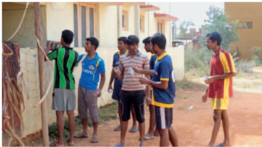
felici... dopo il dovere compiuto