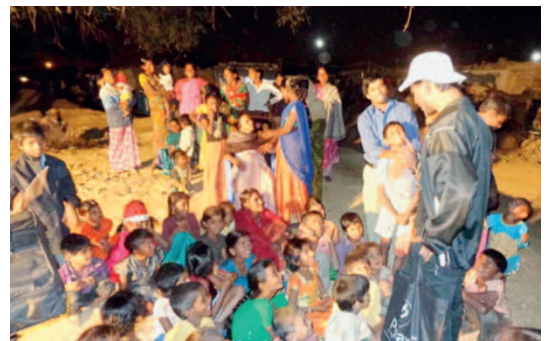
tra i ragazzi della baraccopoli

In primo luogo abbiamo interagito con la gente per guadagnare la loro amicizia e creare un'atmosfera gioiosa. Poi abbiamo eseguito il programma che avevamo preparato per loro. Particolarmente seguite e apprezzate sono state le scenette comiche. Abbiamo anche invitato i bambini a ballare e a cantare alcuni canti locali, ricompensandoli della loro partecipazione con la distribuzione di dolcetti. In una scenetta religiosa abbiamo dimostrato in cosa consista il vivere da cristiani, e spiegato lo scopo della venuta di Gesù in questo