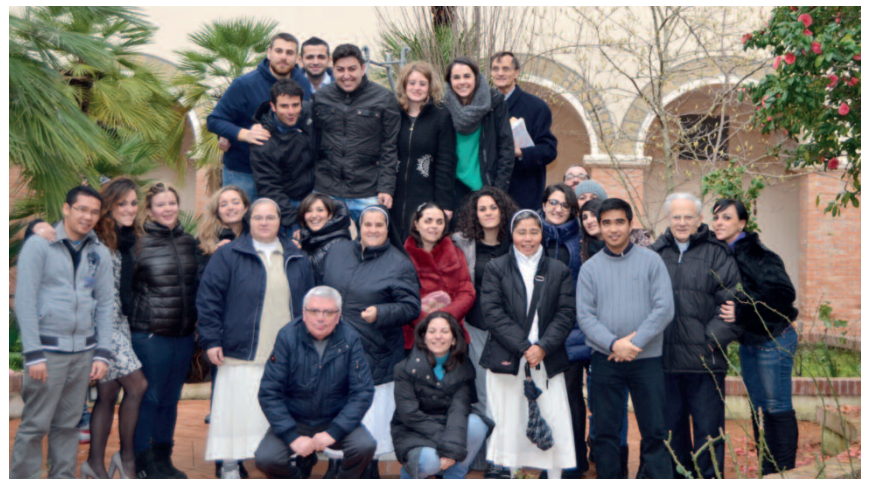
il gruppo del Movimento Giovanile Zaccariano di s. Felice a Canello

Grazie alla tecnologia le comunità barnabitiche nel mondo si sono sentite veramente più prossime e il messaggio evangelizzatore di Paolo, il più grande missionario di tutti i tempi, è risuonato anche attraverso la rete.