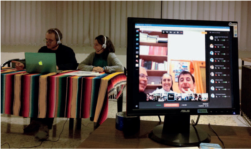
partecipando all'hangout dalla lontana Albania