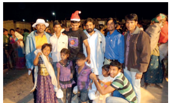
gruppo di seminaristi che ha partecipato allo spettacolo natalizio