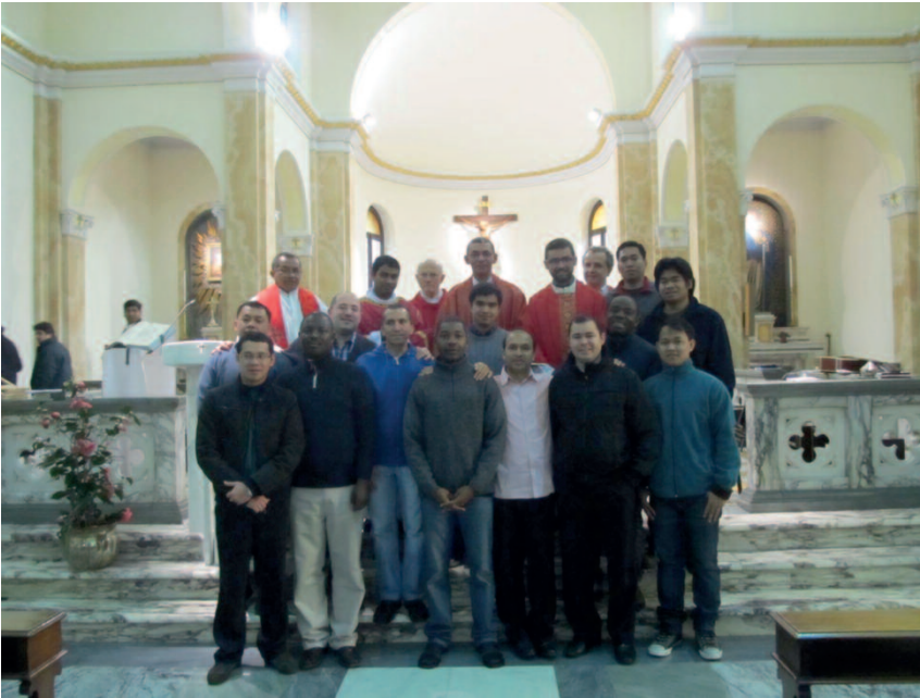
il gruppo dei “tremesanti” al completo con il p. Generale e la comunità formatrice

Dalla fine di settembre sono sbarcati a Roma, si sono sottoposti a un buon corso di italiano che li ha messi in grado di andare per un paio di mesi, fino all'inizio di febbraio 2014, ognuno in una comunità italiana diversa, condividendone la vita e, per quanto possibile, l'attività. Si è trattato di una esperienza, quest'ultima, nuova, che potrà essere eventualmente riproposta anche negli anni seguenti, alla luce dei suggerimenti e delle verifiche di quanto avvenuto quest'anno.