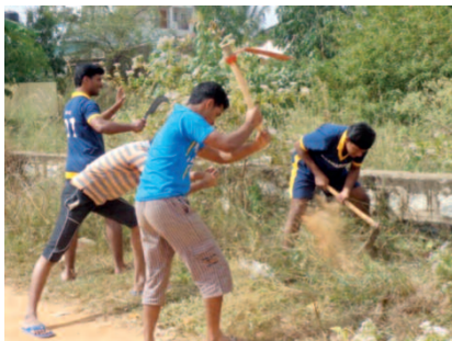
... si dice che la pulizia rende simili alla divinità

mondo per la cui salvezza non solo si è fatto uomo ma ha anche dato tutto se stesso fino al sacrificio della sua vita. Un sacerdote dell'Ufficio di Pastorale Carceraria, di cui è coordinatore il nostro p. Benny, ha offerto ai presenti un messaggio natalizio. Un seminarista, vestito da Babbo Natale, ha invitato i bambini a ballare e cantare e ha distribuito caramelle e cioccolatini. Dopo una serie di giochi per i bambini c'è stata anche una lotteria con regali per i dieci più fortunati. A tutti è stato donato un pacchetto regalo preparato dalle suore. A conclusione della serata seminaristi, sacerdoti, e suore hanno condiviso la cena in santa allegria con gli abitanti della baraccopoli.