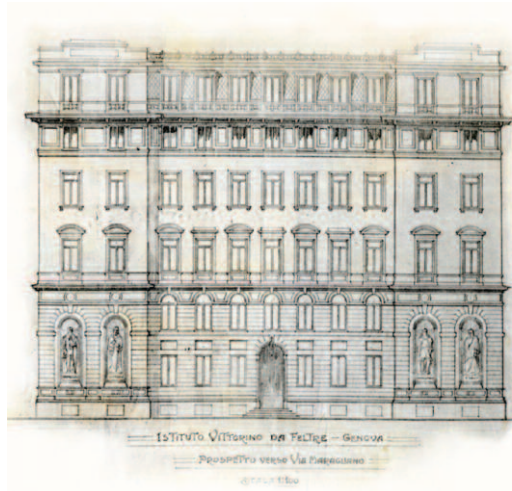
prospetto dell'Istituto Vittorino da Feltrè