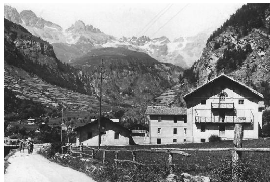
casa alpina di Ollomont (AO)

1927, ottobre - La scuola apostolica, da Asti dove era stata trasferita nel 1919, ritorna a Genova, nei piani alti dell'Istituto "Vittorino" e padre Clerici ne è nominato direttore. Nello stesso anno ricorre il 50° di fondazione del Circolo giovanile sant' Alessandro Sauli, confluito nel 1932 nell'Associazione della Gioventù Cattolica.