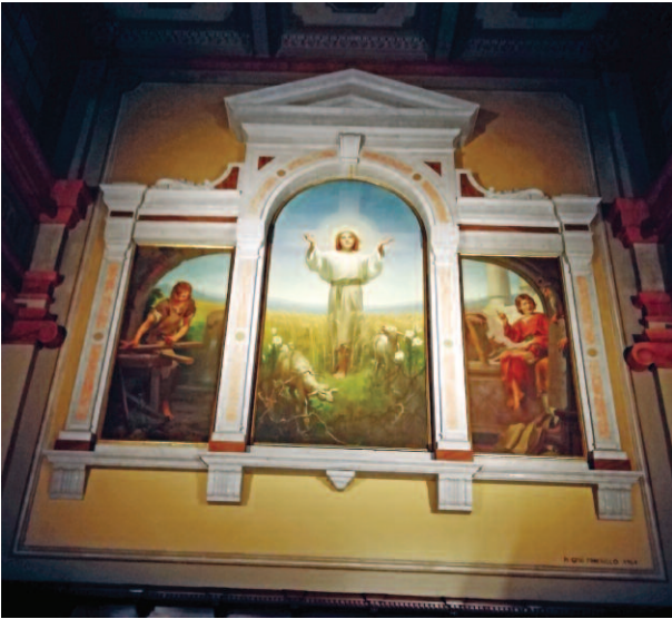
trittico di Gesù Adolescente di mano di Mattia Traverso nell'abside dell'omonima chiesa a Genova