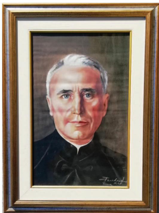
ritratto di p. Idelfonso Clerici ai tempi del suo lungo generalato

Per toglierci dall'ambiguità, per rispondere agli inquietanti interrogativi che sorgono spontanei nel nostro pensiero, noi, in occasione della presente