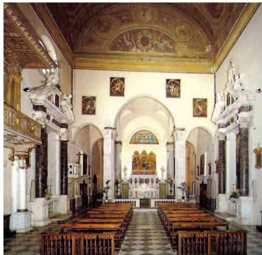
interno della chiesa di San Bartolomeo degli Armeni