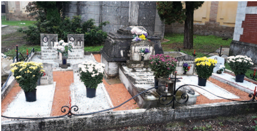
Genova - Staglieno: tomba dei padri barnabiti

vo da dire – ci venga un messaggio tanto attuale e pertinente.