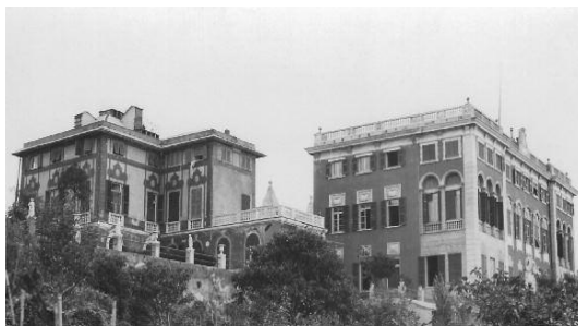
Villa Peirano (sin.) e Casa Missionaria (des.)

1950, 12-17 maggio - Pellegrinaggio a Roma, per l'Anno Santo, degli alunni dei Collegi barnabittici d'Italia. Viene offerto al S. Padre Pio XII un grosso album, con circa 10.000 firme, e il volume Il mio Giubileo , che raccoglie un'antologia di risposte degli alunni sul tema: "Che cosa direi al Papa se gli potessi parlare".