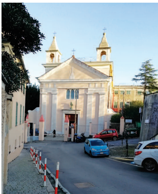
facciata della chiesa di Gesù Adolescente, annessa alla Casa Missionaria

1951, 21 ottobre - Per la canonizzazione del santo barnabita Francesco Saverio M. Bianchi, il mondo barnabittico si ritrova idealmente a Roma intorno al padre Generale.