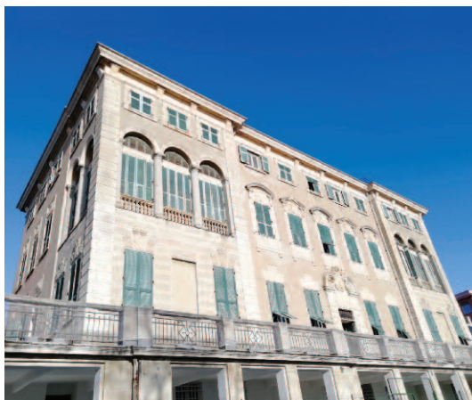
foto recente della Casa Missionaria