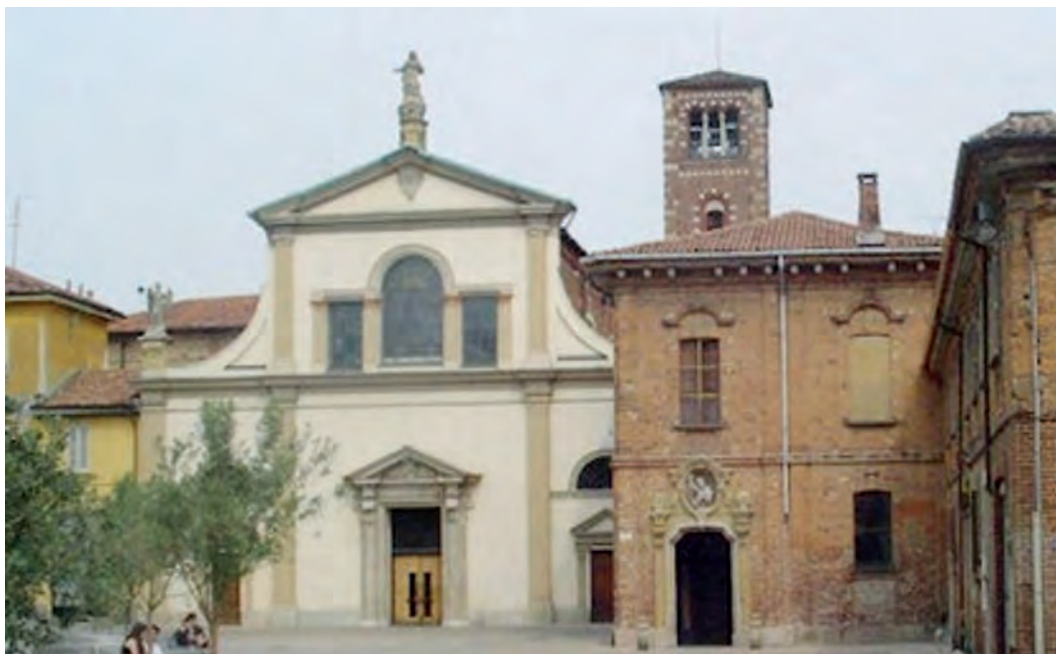
Monza - facciata di Santa Maria in Carrobiolo e convento dei barnabiti