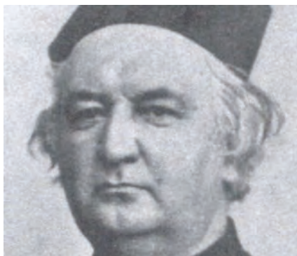
p. Francesco Saverio de Ravignan

role, ho intrapreso un viaggio che mi ha portato a salire di verità in verità, di chiarezza in chiarezza, fino a trovare il luogo del mio riposo nella vita claustrale.