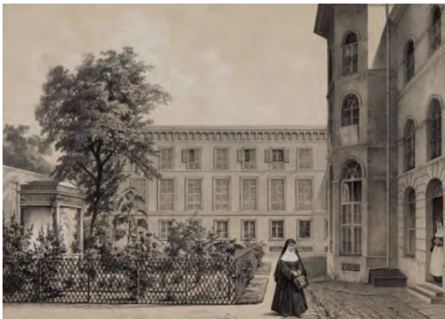
Parigi - Couvent des Oiseaux delle suore della Congregation de Nôtre-Dame

AMŠ: In pratica sono stato viaggiatore e pellegrino. Cosa vuoi sapere? Dove sono stato? Presto detto: nei primi